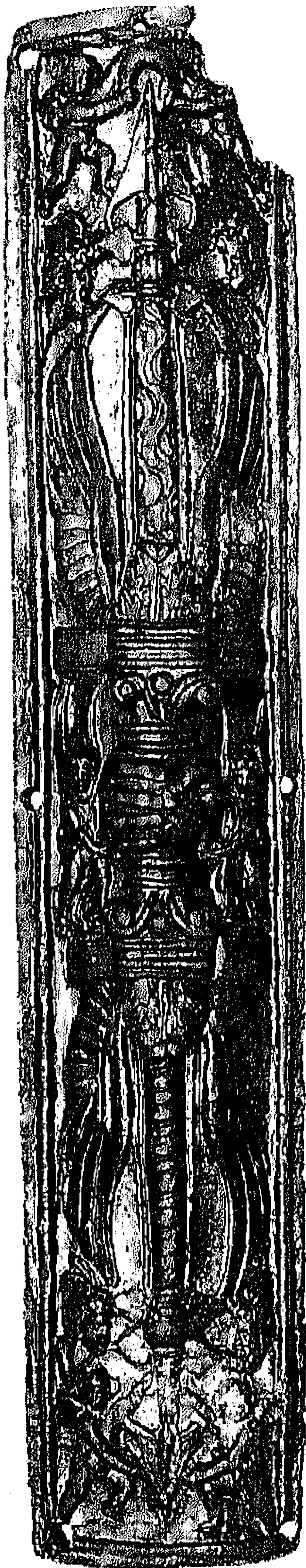
Afb. 1. Nijmegen, Hunerberg, 1991. Bronzen reliëfplaat. Schaal 1 : 2.