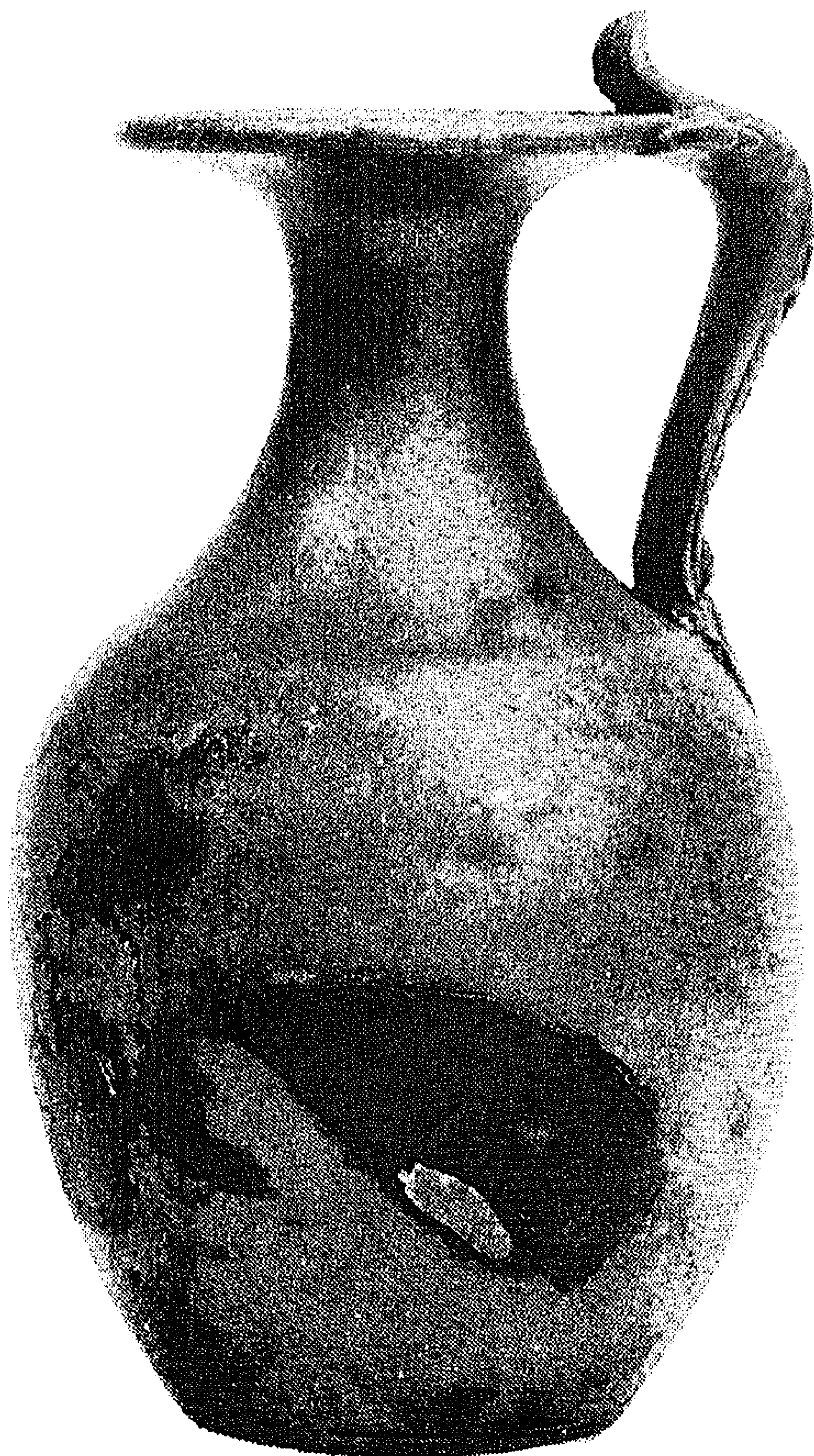
1. Bronzen kan uit Echteld-IJzendoorn; grootste hoogte: 19 cm.

Tot de collectie van Museum Hertogsge- maal, dat gelegen is aan de Rosmalensedijk te 's-Hertogenbosch-Gewande, behoort een Romeinse kan van een geelkoperlegering, die om velerlei redenen hoogst merkwaardig mag worden genoemd (afb. 1). Zeer waar- schijnlijk is ze in 1984 gevonden in het Gel- derse rivierengebied, en wel te IJzendoorn in de gemeente Echteld, naar verluidt bij graafwerkzaamheden in de uiterwaard van de Waal, naast een zanddonk, aan de rand van een baggergat, onder de grondwater-