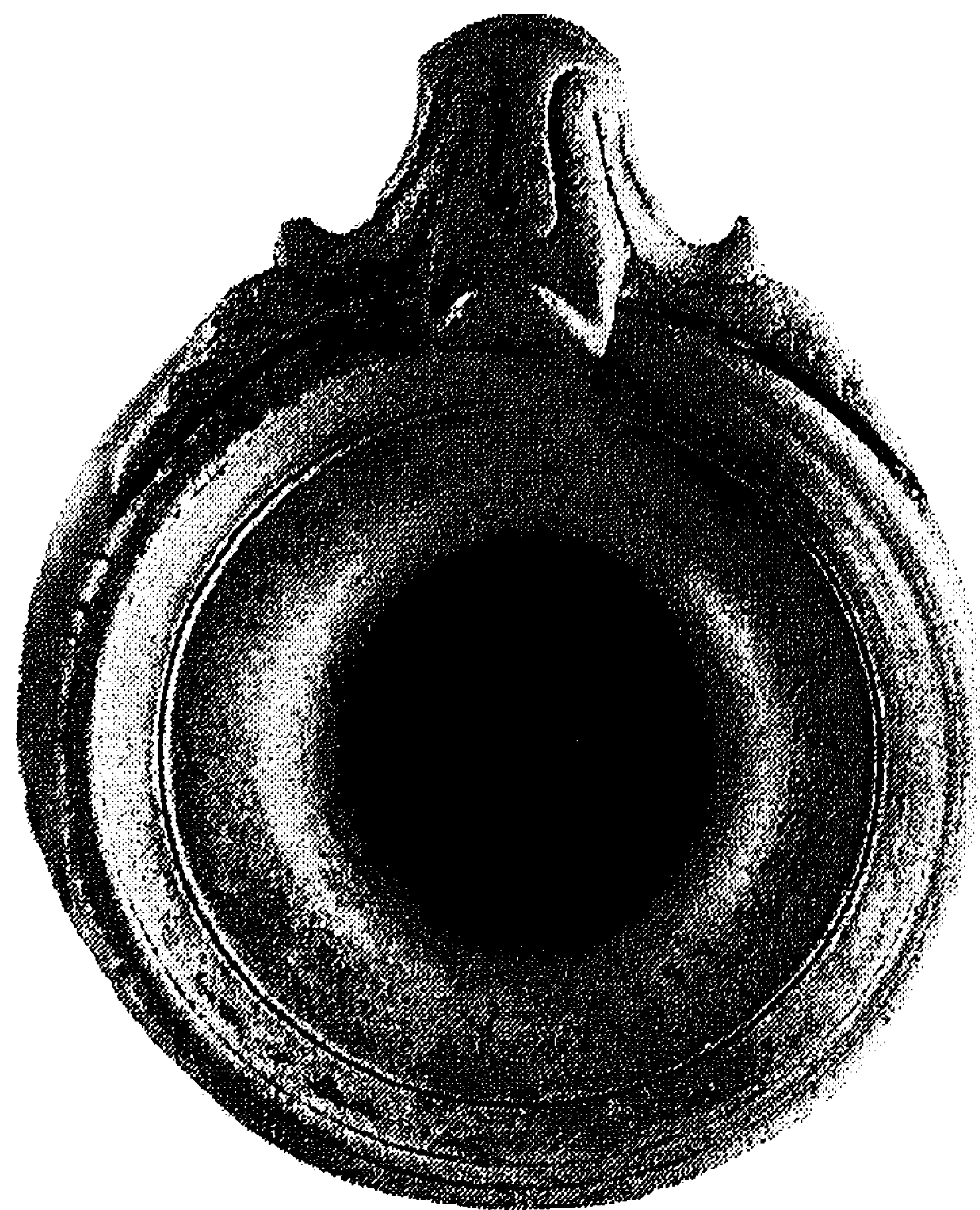
3. Bovenaanzicht met inscriptie in puntschrift; grootste diameter van de monding: 7,7 cm.

Het onderste deel van het oor was waarschijnlijk versierd met een bladmotief, maar daarvan zijn alleen links en rechts boven nog enige gebogen groefjes waarneembaar. Daartussenin is het vlak gevuld met een wel zeer opmerkelijke vrouwenfiguur. Deze is gekleed in een lang gewaad met klokrok, dat tot vlak boven de voeten neervalt en met een ceintuur is opgeschort. Ze draagt geen