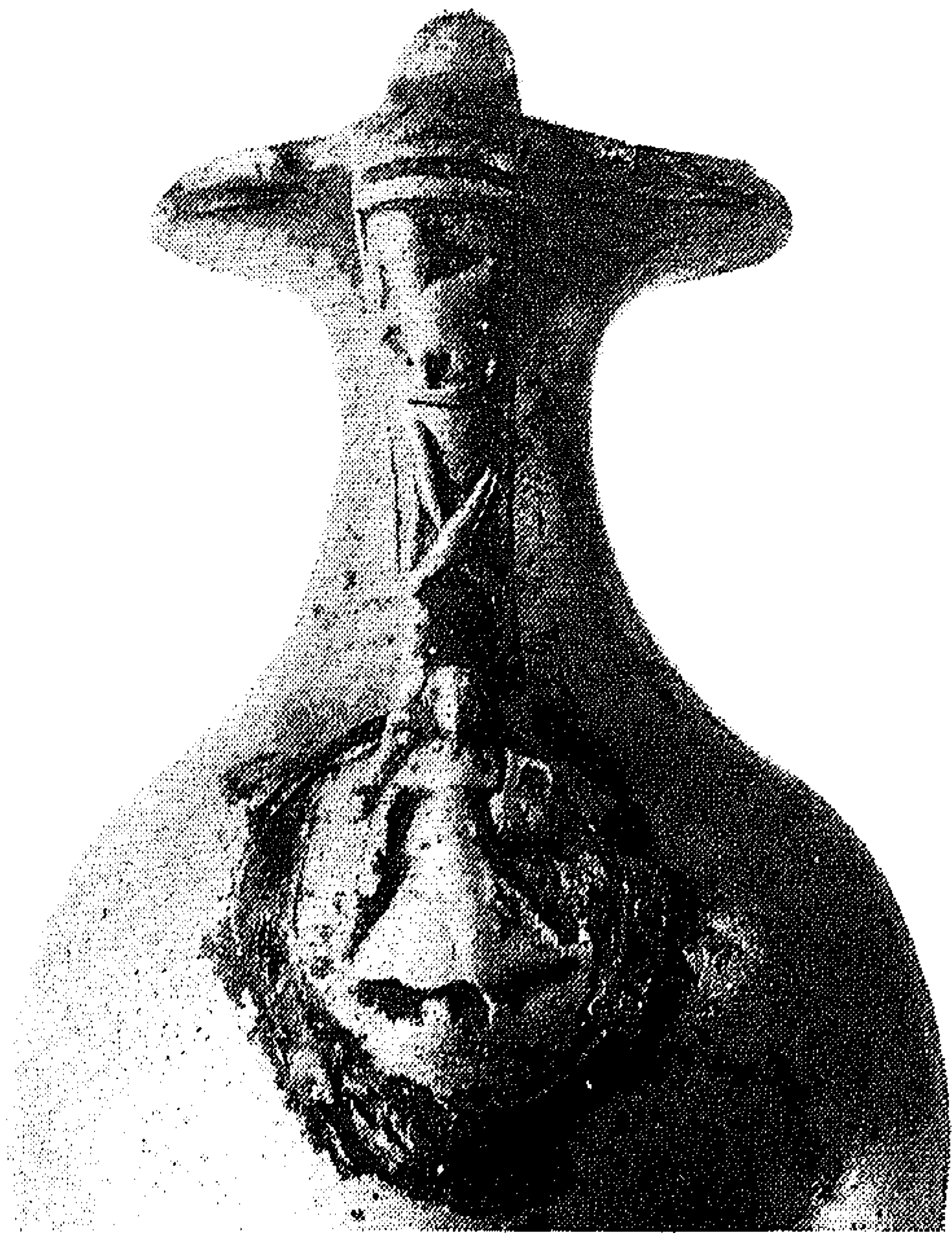
2. Detailopname van het met reliëf versierde oor.

secundair met soldeer aan de kan is bevestigd. De rand van de monding is - om welke reden dan ook - aan de buitenkant enige malen verticaal ingesneden (afb. 3, links boven); vier van de daardoor ontstane groefjes worden gedeeltelijk bedekt door een van de twee sterk gestileerde vogelkoppen met lange snavels die langs de opening van de kan zijn gelegen en waarin het oor aan de bovenzijde uitloopt 5 .