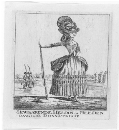
Afbeelding 2: Spotprent van een gewapende donatrice (omstreeks 1784).