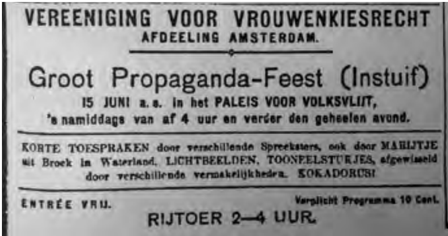
Afb. 1 Een aankondiging van een propagandabijeenkomst van de Vereeniging voor Vrouwenkiesrecht. Afbeelding afkomstig uit De Telegraaf , 14 juni 1912.

tweede internationale congres van de Wereldbond voor Vrouwenkiesrecht, waardoor opnieuw veel nieuwe leden zich meldden. In 1900 telde de Vereeniging niet veel meer dan duizend leden, die verdeeld waren over vijftien afdelingen. Al snel na het congres groeide het ledenaantal tot bijna het tienvoudige in 1910, verdeeld over 97 afdelingen. 24 De vrouwen van de Vereeniging waren zeer bedreven in het bedenken van een grote verscheidenheid aan propagandamiddelen, die op grote schaal werden verspreid. Er werden reclameplaten, prent- en briefkaarten, vlaggen en vaandels gebruikt, maar ook potloden, vlaggetjes, speldjes, postzegeletuis en vingerhoeden. Daarnaast werd er gebruik gemaakt van strijdlieparen, toneelstukjes, proza en poëzie. 25