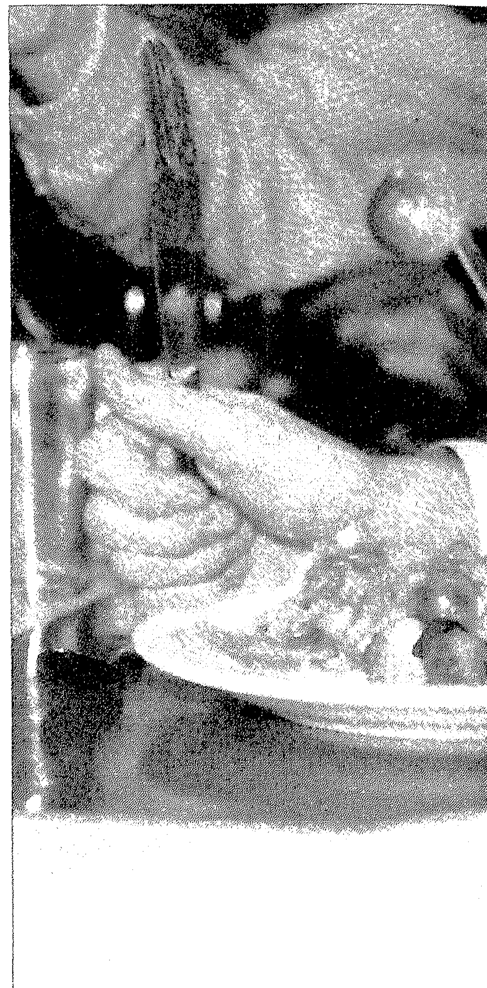
Vrijwilliger eet spruitjes.

Bij mensen werd een cross-over-studie gedaan naar de effecten van de consumptie