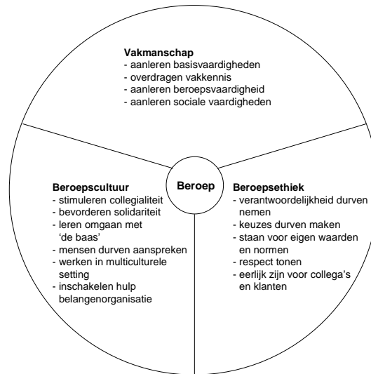
Figuur 1 - Domeinen van beroepsvorming

In het onderzoek is uitgegaan van een visie op het beroep als opgebouwd uit domeinen van beroepsvorming. Deze domeinen kunnen als volgt in kaart worden gebracht: