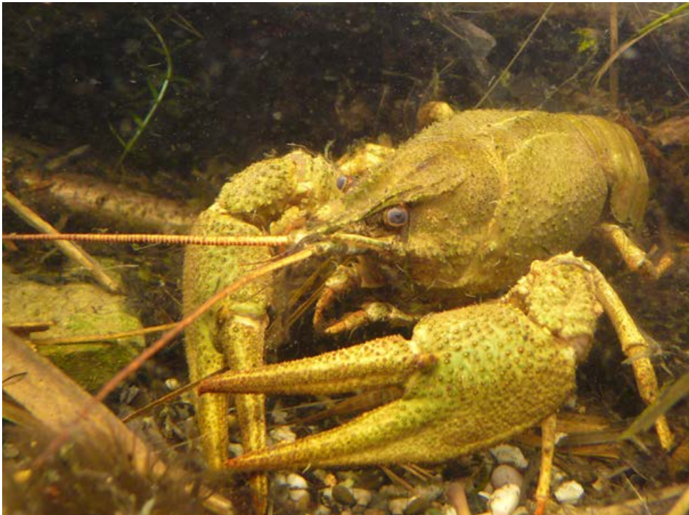
FIGUUR 5 De Turkse rivierkreeft ( Pontastacus leptodactylus ) heeft in Limburg één populatie in het geïsoleerde stuwmeer Cranenweyer in de gemeente Kerkrade (foto: Bram Koese).

nente aanwezigheid van aaneengesloten watersystemen. Negatieve effecten zijn voornamelijk te verwachten door graafactiviteiten. Bij Kinderdijk (Gelderland) is de soort aangetroffen in tientallen meters geperforeerde boezemkadedijk waarbij de schade werd geraamd op € 20.000 per tien strekkende meter dijk (LEMMERS et al. , 2018). Door het graafgedrag dat vergelijkbaar is met dat van de Rode Amerikaanse rivierkreeft zijn de ecologische risico's van de Gestreepte Amerikaanse rivierkreeft waarschijnlijk vergelijkbaar en dus hoog.