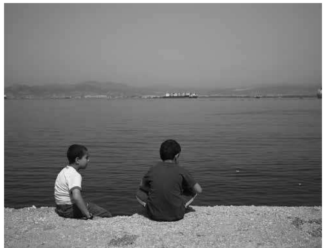
Kampen bij Athene en op Lesbos