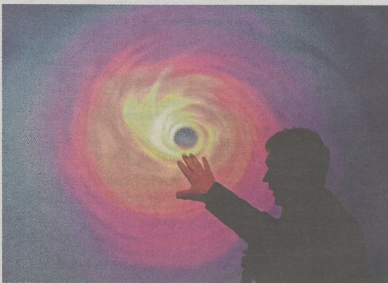
De visualisatie van het zwarte gat en de geel-rode draaikolk van gas.