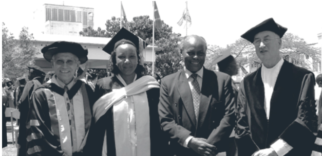
Graduation ceremony, KCM College, Tanzania, 8 november 2003