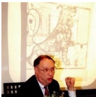
Fig. 2. Hugo de Schepper en el homenaje de Nimega

modo, el profesor Hugo de Schepper es uno de los principales especialistas en el tema sobre el que ha versado el congreso, como es la Historia de las Instituciones de los Antiguos Países Bajos. De hecho, uno de los momentos álgidos del encuentro resultó ser el momento en que el profesor Hugo de Schepper, pese a su avanzada edad y delicado estado de salud, explicó a todos los presentes en tres idiomas el plan de publicación de la que fue su tesis doctoral, presentada en 1972 y que versa sobre los Consejos Colaterales, que verá la luz el año que viene con una actualización bibliográfica y de investigación en la Commission Royale d'Histoire de Bélgica. Con el título de De Regeringsraden naast Landsheren en Landvoogden in de Habsburgse Nederlanden , esta obra ha representado una referencia ineludible para todos los historiadores de la denominada Revuelta de los Países Bajos durante los últimos 40 años.