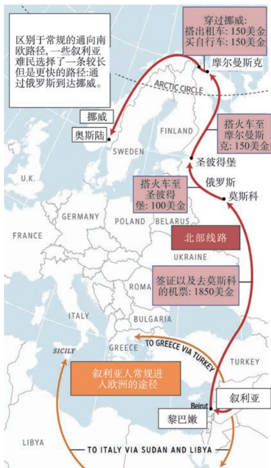
图2 叙利亚难民的移民路线