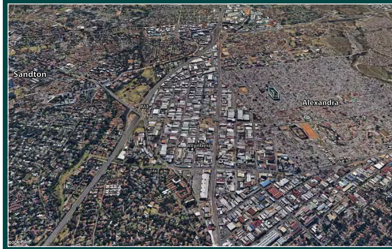
Googlebeeld van de rijke wijk Sandton en poor black men's Alexandra, gezien vanuit het zuiden

In de tijd van de apartheid zijn vele hostels gebouwd om jonge mannen te huisvesten die van het platteland naar de steden kwamen om in de mijnen en fabrieken te werken. In Alexandra, de township op een steenworp afstand van het nieuwe zakencentrum