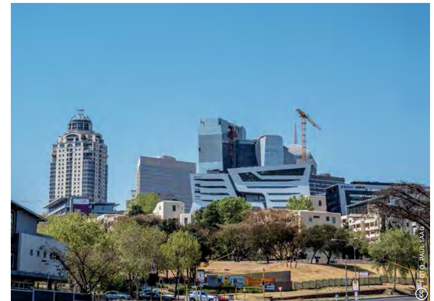
Zicht op shoppingmall Sandton City (links) en andere moderne kantoren in de wijk Sandton.

Er zijn doorlopend pogingen ondernomen om de wijk een ander aanzien te geven, maar geen daarvan slaagde. Zo wilde men in 1980 de wijk omvormen tot een gardencity met een compleet nieuwe plattegrond en minder huizen, wel voor zwarte bewoners. Het masterplan riep zo veel protest op dat het werd ingetrokken na de beruchte Alex Six Days-opstand in februari 1986, waarbij 40 doden vielen. Ook van het daarop volgende Urban Renewal Plan kwam niets terecht door de politieke onrust begin jaren 90.