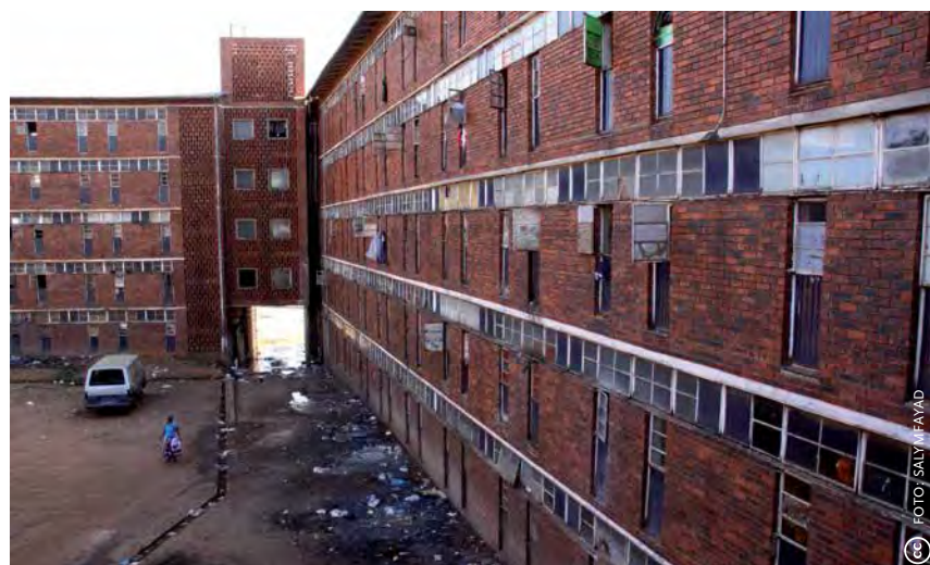
De hostels in Alexandra uit de jaren 70 huisvesten nog altijd duizenden zwarte jonge mannen.

De men's hostels zijn berucht in Zuid-Afrika. Het zijn no-go areas , zelfs voor de politie. Regelmatig komen er bij invallen agenten om. Als de politie er binnenvalt, gebeurt dat met veel manschappen en machtsvertoon. Bijvoorbeeld op 22 april 2015. De agenten waren op zoek naar wapens, drugs en gestolen goederen. De hostels zijn broeinesten van geweld, criminaliteit en vreemdelingenhaat. In 2015 kwamen ze negatief in het nieuws doordat vanuit deze hostels aanvallen op buitenlanders (Zimbabwanen, Mozambikanen) georganiseerd werden. Hierbij kwamen zeven buitenlanders om het leven (zie kader op pag. 34). De uitbarstingen van vreemdelingenhaat vinden hun oorsprong in diepgewortelde onvrede en massale werkloosheid. De inwoners menen dat migranten meer kansen krijgen en hun banen inpikken.