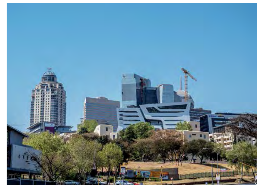
Zicht op shoppingmall Sandton City (links) en andere moderne kantoren in de wijk Sandton.

Er zijn doorlopend pogingen ondernomen om de wijk een ander aanzien te geven, maar geen daarvan slaagde. Zo wilde men in 1980 de wijk omvormen tot een gardencity met een compleet nieuwe plattegrond en minder huizen, wel voor zwarte bewoners. Het masterplan riep zo veel protest op dat het werd ingetrokken na de beruchte Alex Six Days-opstand in februari 1986, waarbij 40 doden vielen. Ook van het daarop volgende Urban Renewal Plan kwam niets terecht door de politieke onrust begin jaren 90.