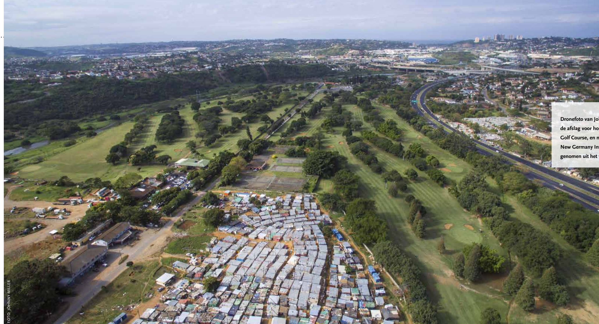
Dronefoto van Johnny Miller met rechtsonder de afslag voor hole 6 van Papwa Sewgolum Golf Course, en middenonder een deel van de New Germany Informal Settlement. De foto is genomen uit het westen.

De 18-holes golfbaan ligt aan weerszijden van de New Germany Road in Reservoir Hills, een stadsdeel in het noordwesten van eThekweni, de grootstedelijke gemeente met de metropool Durban als kern. Aan de noordzijde van de golfbaan stroomt de Umgeni