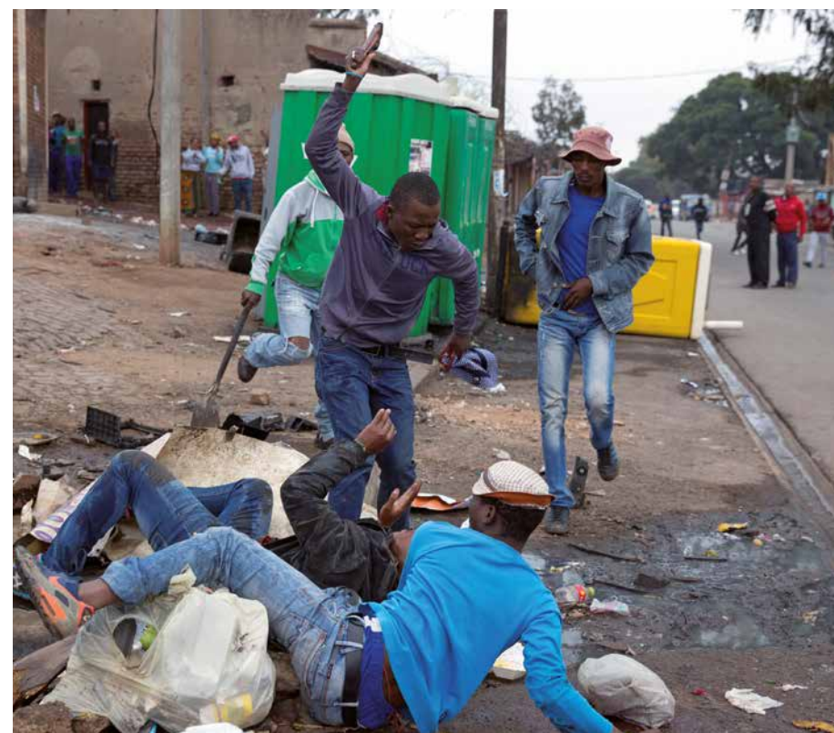
Nadat Zoeloekoning Goodwill Zwelithini in april 2015 verkondigde dat buitenlanders terugmoesten naar hun eigen land, werden mannen en vrouwen uit Zimbabwe, Mozambique en Malawi door Zoeloes bekogeld, geslagen en verjaagd uit shacklands en townships .