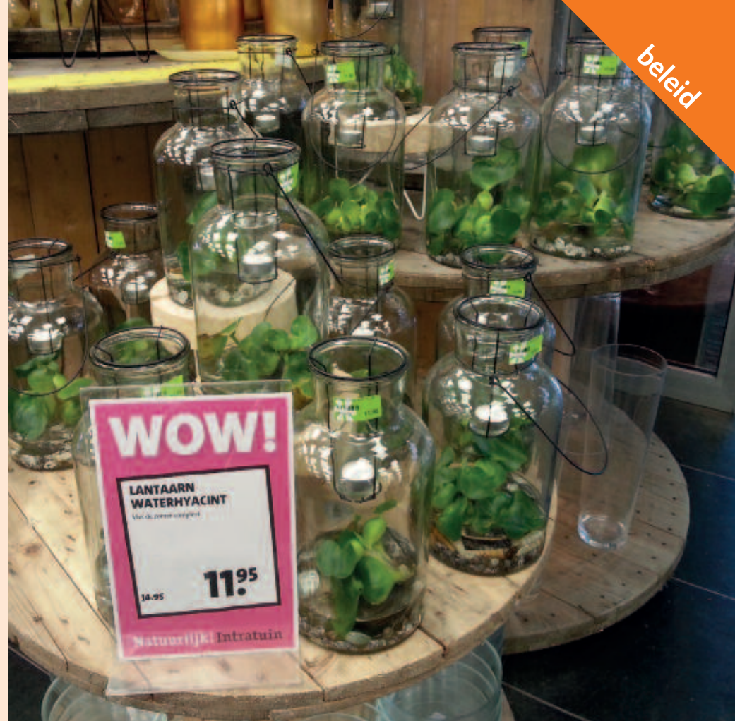
Foto 2. Waterhyacint ( Eichhornia crassipes ) staat op de Unielijst. Verkoop van de bestaande voorraad aan niet-commerciële houders mag onder bepaalde voorwaarden tot maximaal één jaar na plaatsing op de lijst.

De eerste Unielijst bevat slechts 0,3% van de tenminste 12.000 in Europa voorkomende exoten. Dit roept vragen op over de reikwijdte van de EU aanpak. Voor deze korte lijst zijn echter meerdere redenen. Slechts 10-15% van de exoten is invasief. Een deel hiervan kan zich niet vestigen of vormt geen hoog risico voor biodiversiteit en ecosystemendiensten in minimaal twee lidstaten en komt daarom niet in aanmerking voor de Unielijst. Voorts geldt de verordening niet voor soorten die in één of meerdere EU-lidstaten inheems zijn, zoals Ponto-Kaspische grondels, vlokreeften en mosselen. Deze exoten hebben overigens wel grote ecologische effecten in Nederland en hun verspreiding in de EU is snel toegenomen na de verbinding van het Rijn- en Donaustroomgebied door het Main-Donaukanaal (Leuven et al., 2009; Matthews et al., 2014; van Kessel et al., 2014). Ook exoten die uitsluitend problemen veroorzaken in verafgelegen EU-gebieden zijn uitgezonderd, zoals de