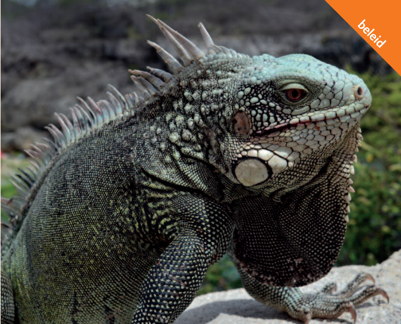
Foto 3. De groene leguaan ( Iguana iguana ) komt niet in aanmerking voor plaatsing op de Unielijst.

spreide invasieve soorten is immers een gelijktijdige en goed afgestemde aanpak nodig die (inter)nationale coördinatie vereist.