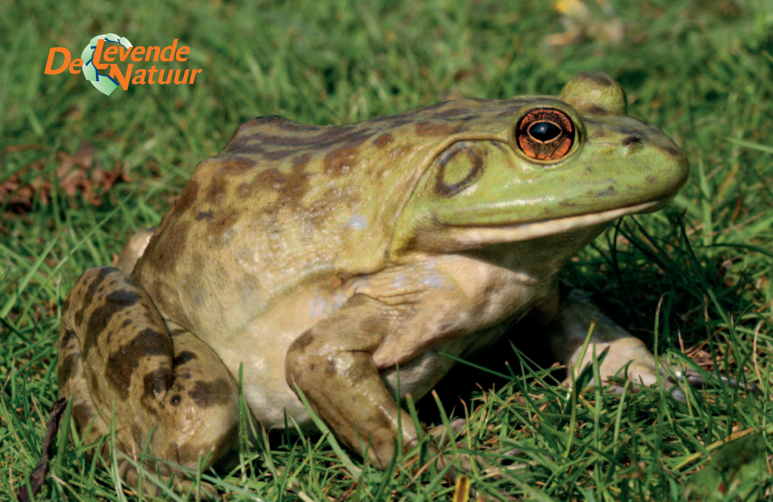
Foto 1. De Brulkikker ( Lithobates catesbeianus ) is een invasieve exoot van EU belang en succesvol bestreden in Nederland.