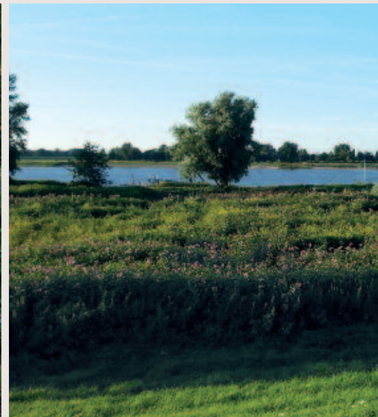
Foto 3. Reuzenbalsemien domineert de vegetatie (donkergroene plekken met paarse bloemen) in grote delen van de Beuningse uiterwaarden langs de Waal.

Slechts enkele plantensoorten, zoals de uitheemse Japanse duizendknoop ( Fallopia japonica ) met een sterke vegetatieve vermeerdering en dicht wortelstelsel (Oldenburger & Penninkhof, dit nummer), weerstaan de concurrentie van reuzenbalsemien. De soort wordt ook weinig gegeten door herbivoren. Bladeren worden gemineerd door larven van de mineervlieg Phytoliriomyza melampyga , die alleen voorkomen op het geslacht Impatiens (www.bladmineers.nl). Deze vlieg heeft sterk geprofiteerd van de uitbreiding van springzaadsoorten en komt nu in heel Nederland voor. Hij houdt echter de springzaden door zijn geringe bladschade niet in toom. Dominantie door reuzenbalsemien verandert de vegetatiestructuur en leidt tot monospecifieke vegetaties (Hejda & Pyšek, 2006). Hierdoor vermindert de faunadiversiteit (Tanner, 2011). Hoge en dichte bestanden langs beken en kleine rivieren beschaduwen oeverbiotopen, waardoor ook aquatische habitatfuncties