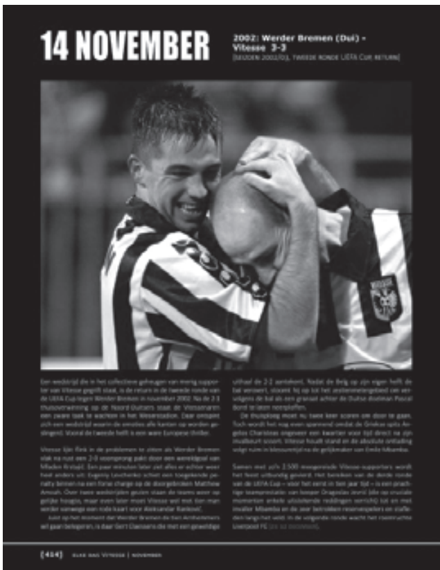
Vitesse: 14 november

tig, meer dan bijvoorbeeld de jaren zeventig en tachtig samen – hoewel dit tevens kan komen doordat Reurink deze periode zelf als jonge supporter het meest intens heeft beleefd. Ook financiële problemen worden maar kort benoemd, en de controversiële oud-voorzitter Karel Aalbers wordt gespaard en zelfs ‘illuster’ genoemd (3 oktober).