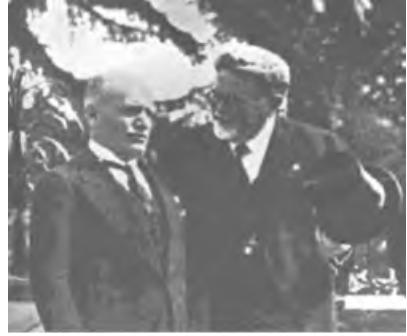
Giovanni Gentile (rechts) samen met Benito Mussolini (links).