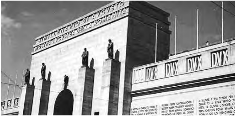
De ingang van de tentoonstelling, afbeelding (mostra augustea della romanita) is ontleend aan: http://www.museociviltaromana.it/var/museicivici/storage/images/musei/museo_della_civilta_romana

de invloed van het fascisme door – overigens terecht – te stellen dat al in 1908 een initiatief werd genomen tot een dergelijke manifestatie, waaruit hij, toch ietwat kort door de bocht, concludeerde dat de Augustusviering in 1937-38 enkel een uitgebreider vervolg was van de Mostra Archeologica uit 1911. Vlekke analyseerde de tentoonstelling anders; ook hij prees de collectie, maar hij benoemde tevens de doelen van de fascistten. 18 Dat hij de enige was die de expositie bestempelde als fascistische propaganda betekent evenwel niet dat de andere medewerkers het fascisme steunden, noch dat hijzelf geheel negatief ten opzichte van de Italiaanse machthebbers stond.