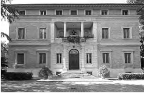
Het Nederlands Instituut te Rome.