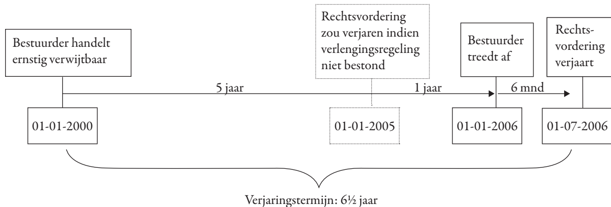
Figuur 2 Verjaringstermijn zou aflopen binnen zes maanden na het verdwijnen van de verlengingsgrond