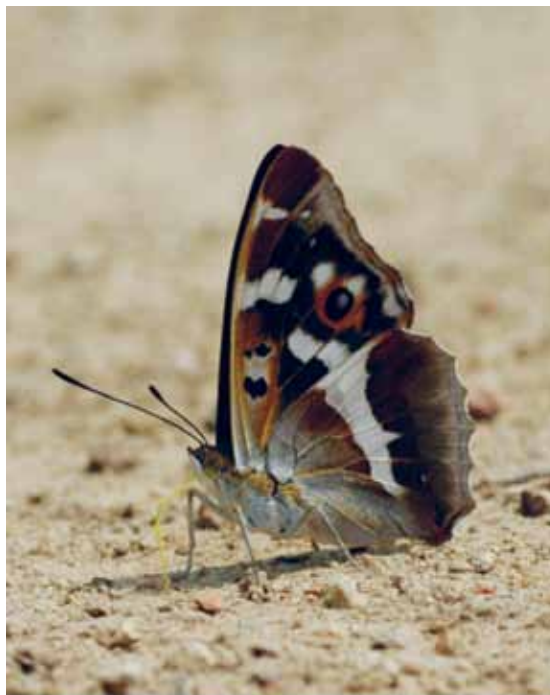
Figure 4 the Purple emperor is very rare in the Netherlands. Its habitat can increase significantly when cover sand forests become wetter and thereby more suitable for its host goat willow.

Figuur 4 de grote weerschijnvlinder is zeer zeldzaam in Nederland. Het leefgebied kan aanzienlijk toenemen wanneer dekzandbossen natter worden en daarmee geschikter voor de waardplant boswilg ( Salix caprea ).