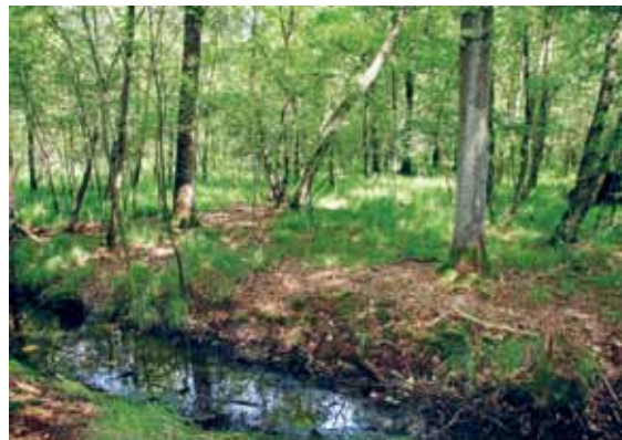
Figuur 1 kenmerkend beeld van een berken-eikenbos op een verdroogde groeiplaats, met dominantie van pijpenstrootje ( Molinia caerulea ) en een verder soortenarme ondergroei. Foto Rob van der Burg .

tratie van regenwater en zijdelingse toestroming van jong, vrij zuur, maar enigszins basenhoudend grondwater (lokale kwel). Dit grondwater bereikt periodiek de humuslaag, waardoor pH en basenverzadiging meestal hoger zijn dan in droge dekzandbossen. Vochtige dekzandbossen zijn arm aan vaatplanten, wat samenhangt met hun basenarme standplaatsen en overwegend jonge leeftijd. Vegetatiekundig ontwikkelen de bossen zich tot vochtige berken-eikenbossen en vochtige naaldbossen. In oudere percelen kunnen zich bijzondere soorten vestigen als dubbelloof ( Blechnum spicant ), stippelvaren ( Oreopteris limbosperma ) en dalkruid ( Maianthemum bifolium ), zie figuur 3, die duiden op ontwikkeling naar vochtige beuken-eikenbossen (H9120). Tot de weinige voorbeelden van goed ontwikkelde oude vochtige dekzandbossen behoren onder meer het Wijnendalenbos