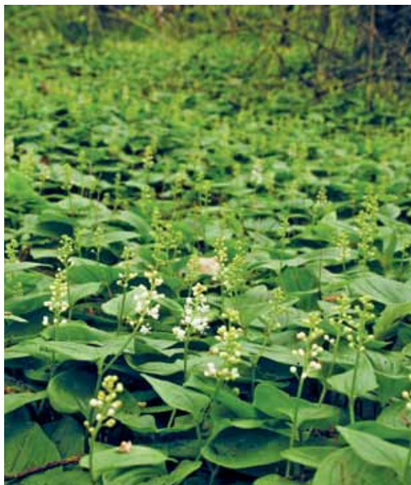
Figuur 3 dalkruid is nu nog een schaarse verschijning op de arme zandgronden, maar onder vochtigere en beter gebufferde condities wordt het vestigingsklimaat voor deze soort aanzienlijk beter.