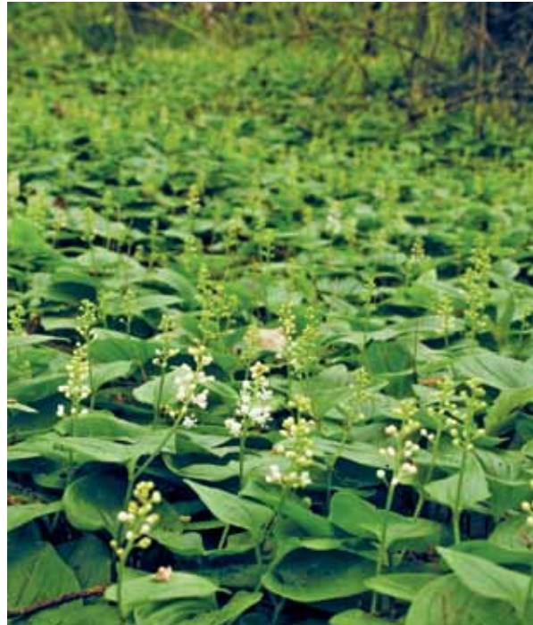
Figuur 3 dalkruid is nu nog een schaarse verschijning op de arme zandgronden, maar onder vochtigere en beter gebufferde condities wordt het vestigingsklimaat voor deze soort aanzienlijk beter.