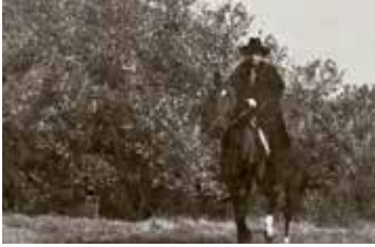
• • • De Zwarte Ruiter

veroordeeld. 56 De Hoge Raad trekt uit het functioneren van de man een normatieve conclusie door deze handeling als poging tot doodslag te kwalificeren. Zoals we dat nu zeggen ‘bewust aanvaarden van de aanmerkelijke kans’ was genoeg; dat de verdachte de dood van de ander niet wilde, deed er niet toe. 57 Zou een rol hebben gespeeld dat de naoorlogse generatie diep ervan doordrongen was dat mensen niet altijd doen wat ze willen en vaak niet doen wat ze wel willen? Evenzeer van de werkelijke wetenschap van de betrokkene geabstraheerd was het oordeel dat ondanks de niet altijd eenvoudig te doorgronden (economische) ordeningswetgeving niet hoeft vast te staan dat de verdachte heeft geweten dat hij strafbaar handelde, al werd niet uitgesloten dat een beroep op dwaling over het recht kon worden gedaan. 58 In het functionele denken dat geleidelijk aan de overhand krijgt, is rechtspraak een streven naar een billijk oordeel op grond van wat redelijkerwijs maatschappelijk mag worden verwacht en daar paste blijkens het Zwarte Ruiterarrest het meer op billijkheid gerichte adagium “straf naar de mate van schuld” niet bij: ondanks dat de Zwarte ruiter wegens verminderde toerekenbaarheid ter beschikking van de regering werd gesteld, werd hij ook bestraft met 15 jaar gevangenisstraf. 59