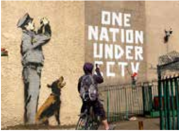
● ● ●, Banksy

wordt terughoudendheid te betrachten in individuele strafzaken, vindt bij de vervolging van belangrijkere zaken veel meer dan vroeger intensief overleg plaats met de top van het OM en het departement. De rechters maken zich de rationalisering ook eigen, streven ernaar zaken efficiënt en tijdig af te doen en geven gehoor aan de wens zich transparant op te stellen. 91 Ze benadrukken het belang van motivering in individuele zaken, formuleren kernwaarden, ontwikkelen professionele standaarden en werken aan hun communicatieve vaardigheden. 92 Rechters maken zich kortom druk over hun imago, ondanks dat rond de 65% van de bevolking blijkt geeft van (een groot) vertrouwen in de rechtspraak. 93 Met het streven naar efficiency en de zorg voor de beeldvorming verinnerlijken ze het beeld dat de justitiabelen hun klanten zijn. De eerste kritiek daarop is inmiddels te horen van de zijde van rechters die het belang van kwaliteit voorop stellen – kwaliteit is het onderwerp van de vergadering van de NJV van 2015, en een centraal thema van het Rapport Visitatie gerechten 2014. 94 Diezelfde beweging van efficiency en verzakelijking, via zorg om het imago naar nadruk op (vakmatige) kwaliteit zien we ook elders in de samenleving bij artsen, professoren en tal van andere professionals en bedrijfstakken.