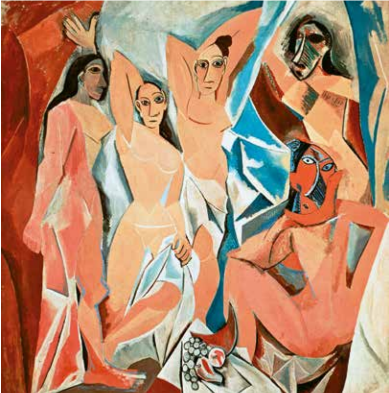
● ● ● Les Demoiselles d' Avignon, Pablo Picasso (1907) (Bron: www.rudedo.be )

drukten dat het niet langer alleen om de daad maar ook om de dader gaat. 12 Omdat het strafrecht met zijn legaliteitsbeginsel – geen straf zonder een daaraan vooraf gegane wettelijke strafbepaling – meer aan de wet moet hechten dan het civielrecht 13 hadden deze inzichten in de eerste plaats gevolgen voor de wetgever. 14 Maar enig effect in de rechtspraak is toch ook te ontwaren, waar werd opgekomen tegen de al te strikte kaders van de wet. In het Melk en Waterarrest (1916) zien we daarvan een voorbeeld met de gedachte dat een ongeschreven norm – geen straf zonder schuld – aan de geschreven wet vooraf gaat. In 1918 kan Taverne in zijn oratie met de titel