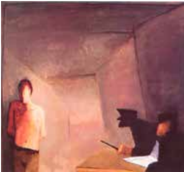
• • • Constant, Het verhoor, olieverf 1983 (Bron: www.argusvlinder.wordpress.com , Fondation Constant)

traditionele, kerkelijke verbanden en het percentage Nederlanders dat “genieten” erg belangrijk vindt neemt stevig toe. 64 Terwijl aanvankelijk min of meer marxistisch geïnspireerde maatschappijkritiek luid wordt gehoord, slaat dat in de loop van dit tijdvak om in een post-modernistische kritiek op de grote verhalen van weleer waarbij het streven naar politieke en economische gelijkheid weer afneemt. Tegen deze achtergrond gaan de mensenrechten in ons land – maar het gebeurde gelijktijdig evenzeer elders – als de ultieme referentie gelden. Steeds vaker wordt de overheid geconfronteerd met eisen van burgers die daarbij een beroep doen op hun individuele rechten en vrijheden. 65