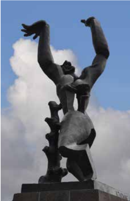
• • • Ossip Zadkine, Verwoeste stad, onthuld in Rotterdam op 15 mei 1953