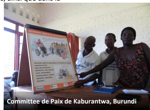
Committee de Paix de Kaburantwa, Burundi

La popularité des CPLs peut être comprise comme une partie d'un 'tour local' dans la consolidation de la paix au cours des deux dernières décennies. Les praticiens du développement sont devenus de plus en plus conscients que, pour être efficaces, les accords de paix au niveau national nécessitent le développement de l'appui au niveau local. De plus, en tenant compte du caractère localisé et civil de nombreux conflits contemporains, les processus de paix au niveau local se sont avérés nécessaires, parallèlement aux initiatives nationales. De même, les résultats décevants sur les programmes de consolidation de la paix et de renforcement de l'Etat impulsés par les bailleurs ont convaincu beaucoup de donateurs de la nécessité de faire participer activement les communautés locales dans la consolidation de la paix, et se baser sur la compréhension contextuelle, et les ressources locales.