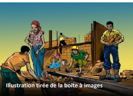
Illustration tirée de la boîte à images

Même si la consolidation de la paix est la principale ambition d'une organisation de développement ou le Comité de paix local, les approches peuvent différer. Diverses organisations au Burundi et en RDC se considèrent comme des organisations de paix spécialisées, et s'efforcent de travailler directement sur les conflits, par exemple par le biais de médicament, la guérison des traumatismes, et la formation des comités locaux dans la transformation des conflits. De nombreuses organisations en RDC estiment qu'un manque de développement économique est un important facteur de déstabilisation et ainsi élargissent leurs activités pour inclure le développement. En particulier là où les populations locales sont fortement divisées politiquement et ethniquement,