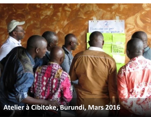
Atelier à Cibitoke, Burundi, Mars 2016

Pour les organisations de développement (inter)nationaux, soutenir les CPLs semble une stratégie appropriée dans les milieux affectés par des conflits, où l'Etat et son système judiciaire ainsi que les institutions traditionnelles et locales sont incapables ou ont perdu la légitimité d'assurer la justice et maintenir de bonnes relations avec la communauté. Les intervenants prévoient qu'ils peuvent propager des solutions locales à des préoccupations pressantes de la justice et de l'insécurité, et de promouvoir la coexistence pacifique entre les anciens ennemis au niveau local. Même si les CPLs ne se conforment nécessairement pas à la réglementation nationale, ils peuvent avoir une légitimité locale et contribuer à la sécurité humaine. Par ailleurs, ils peuvent aussi régler les affaires là où aucune loi locale existe, ou lorsque les institutions coutumières et les