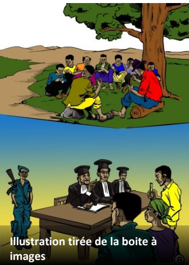
Illustration tirée de la boîte à images

coutumières ont besoin éventuellement d'être adaptées ou d'être intégrées dans l'Etat. Pour les comités de paix locaux, une question importante est donc de savoir dans quelle mesure se baser sur les structures et les normes coutumières.