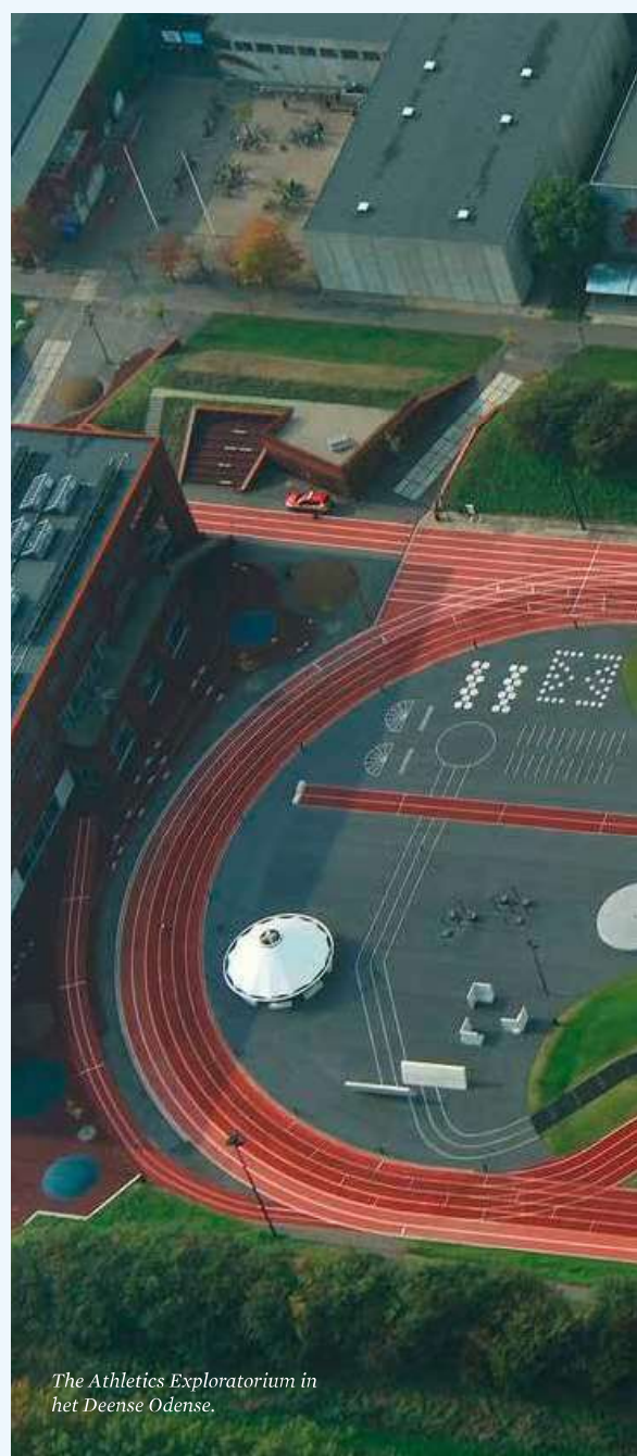
The Athletics Exploratorium in het Deense Odense.

Een dergelijke accommodatie kan ook als startpunt of als plek om te lopen een verrijking zijn voor de grote groep hardlopers die ons land rijk is. Hardlopers maken nu veelal gebruik van de openbare weg. Dat is niet zonder gevolgen. Dit harde asfalt is niet de meest ideale ondergrond om te lopen en werkt blessures in de hand, zeker in combinatie met onervarenheid, ondeskundigheid of overschatting van eigen fysieke mogelijkheden bij de hardlopers. Het blessurerisico voor hardlopen is 5,6 blessures per 1.000 uur. Dat is fors boven het gemiddelde van 2,0 en maakt hardlopen, op zaalvoetbal en hockey na, de meest blessuregevoelige sport. Ook in dit geval kan een voorbeeld genomen worden aan landen om ons heen. In België bijvoorbeeld kennen ze zogeheten 'Finse pistes', onverharde hardlooptroutes voorzien van boomschors of ander dempend materiaal. Een voordeel van deze 'Finse pistes' is dat ze sportdeelname voor een breder publiek faciliteren en door de dempende eigenschappen de kans op blessures aanzienlijk verkleinen.