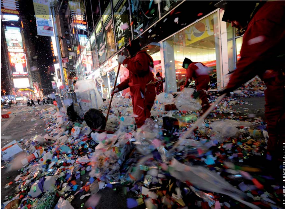
Schoonmakers van het gemeentelijke Department of Sanitation én van de Times Square Alliance zijn op nieuwjaarsdag samen meer dan acht uur in de weer om de restanten van de traditionele oudejaarsviering op Times Square, tussen 34th-59th St en tussen 6th-8th Ave, weg te werken.