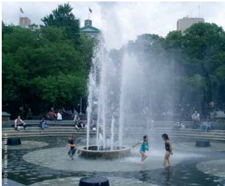
Moses plande een vierbaans snelweg dwars door Greenwich Village en Washington Square Park.

Washington Square Park is tegenwoordig een ontmoetingsplaats voor studenten, schakers, straatmuzikanten, skaters, toeristen en ouders met kinderen.