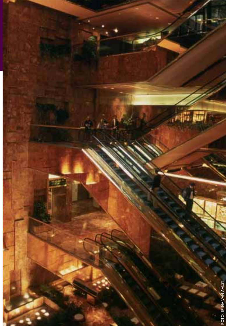
Het interieur van de Trump Tower ziet er zo overdadig luxueus uit, dat je je als passant bijna op verboden privé-terrein waant.