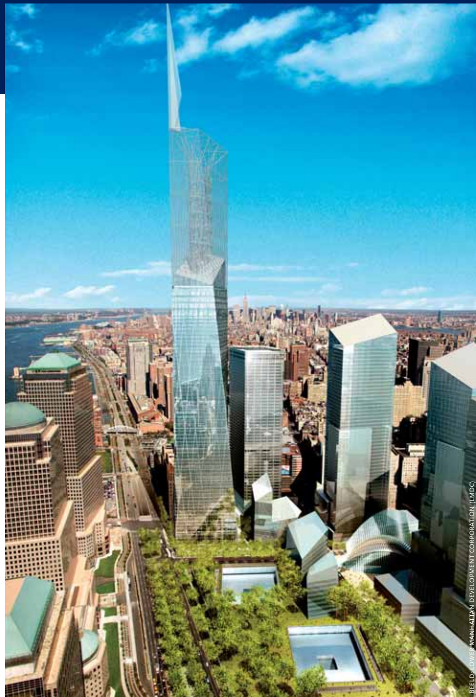
Artist impression van de nieuwe bebouwing op Ground Zero (2004) met de dominante Freedom Tower van Daniel Libeskind. Zicht vanuit het zuid-westen.

Het World Trade Center (WTC) werd ontwikkeld in een tijd dat Lower Manhattan in problemen verkeerde. In de jaren vijftig verhuisden veel bedrijven naar Midtown Manhattan. Deze leegloop was onder andere het gevolg van het gebrek aan winkels, voorzieningen en woningen. Er werden plannen ontwikkeld om de leegloop te stoppen. Een daarvan was de bouw van een groot en prestigieus wereldhandelscentrum door de Port Authority. Deze organisatie leidt het vervoer en transport tussen New York en New Jersey in goede banen, door onder