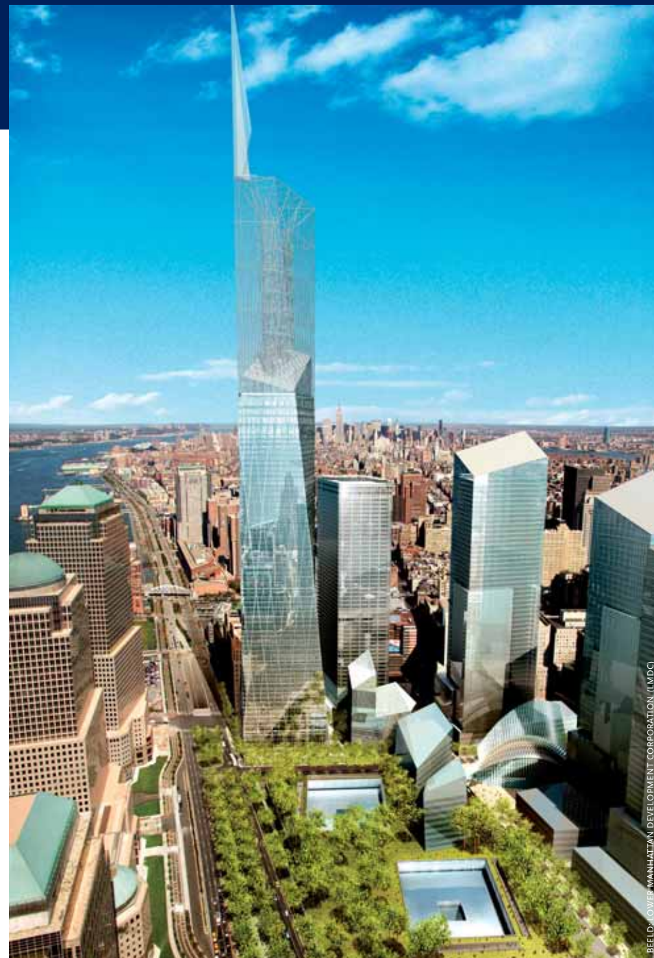
Artist impression van de nieuwe bebouwing op Ground Zero (2004) met de dominante Freedom Tower van Daniel Libeskind. Zicht vanuit het zuid-westen.

Het World Trade Center (WTC) werd ontwikkeld in een tijd dat Lower Manhattan in problemen verkeerde. In de jaren vijftig verhuisden veel bedrijven naar Midtown Manhattan. Deze leegloop was onder andere het gevolg van het gebrek aan winkels, voorzieningen en woningen. Er werden plannen ontwikkeld om de leegloop te stoppen. Een daarvan was de bouw van een groot en prestigieus wereldhandelscentrum door de Port Authority. Deze organisatie leidt het vervoer en transport tussen New York en New Jersey in goede banen, door onder