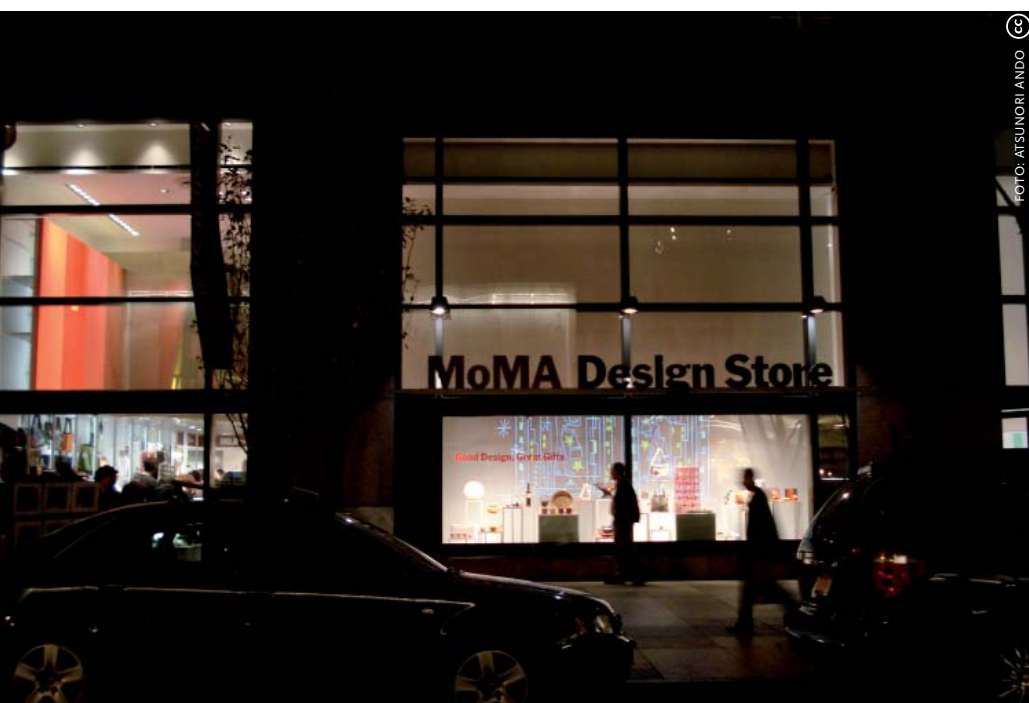
De MoMa Design Store levert een substantiële bijdrage aan de museumkas, met een omzet die zeventvoudige is van de gemiddelde omzet van een Amerikaans winkelcentrum.