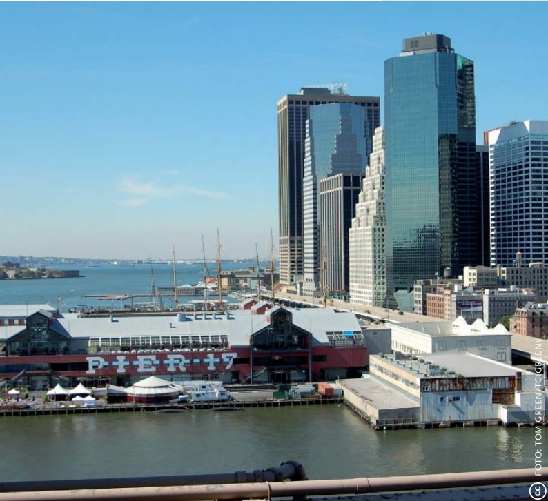
Foto links: De Rouse Company ontwikkelde Pier 17 als festival market. Er kwam een shopping mall met luxe winkels, galeries en restaurants, en een aantal historische havenstraatjes werd herbouwd.