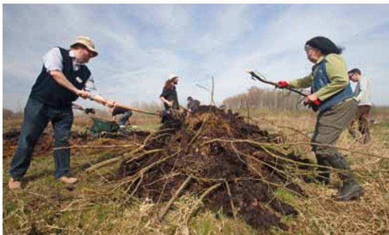
Figuur 4: In de 21e eeuw helpen vrijwilligers de ringslang middels de aanleg van eiafzetplekken (mesthopen).

The Grass Snake ( Natrix natrix ) is the only oviparous reptile species able of maintaining sustainable populations in