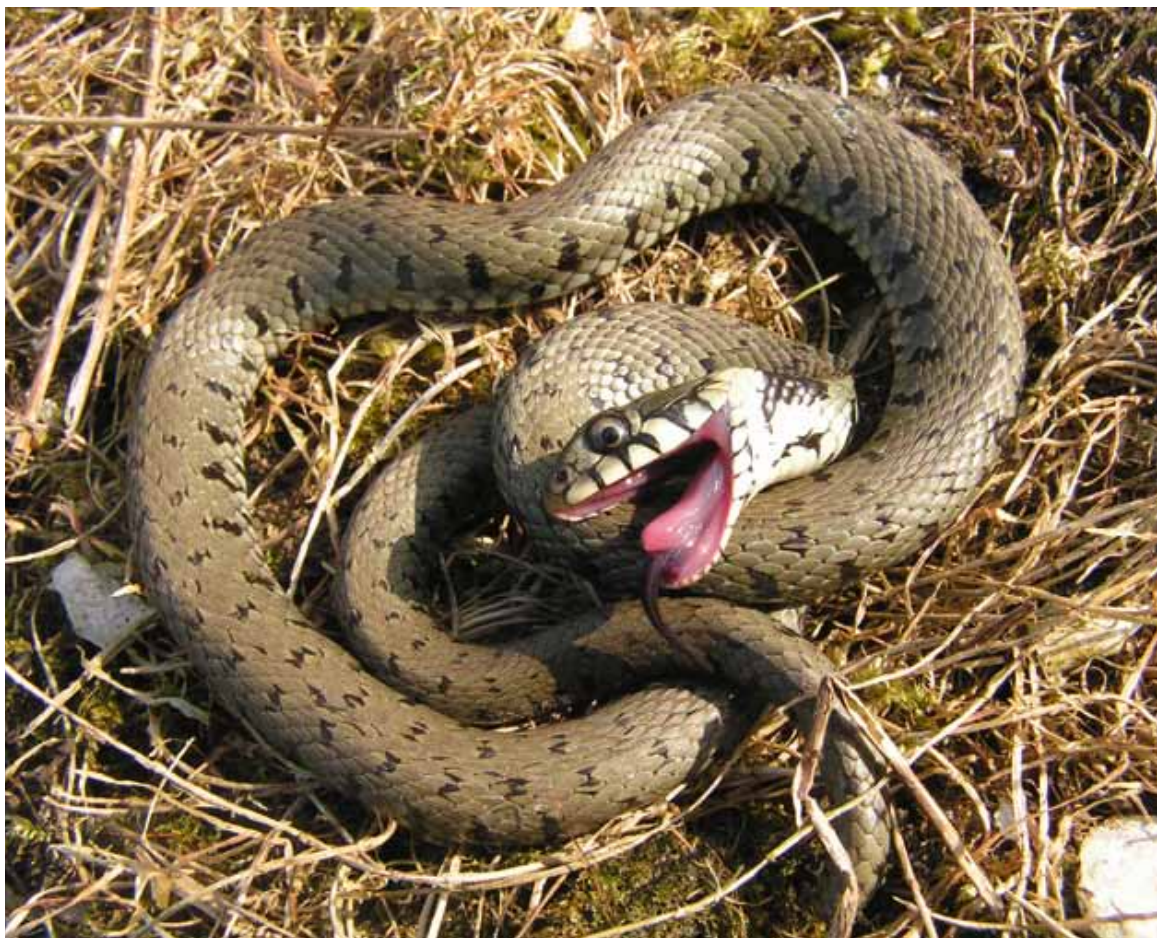
Figuur 2: Een zich dood houdende ringslang; een bekend afweergedrag.

De Vlaams-Nederlandse auteur Jacob van Maerlant (1225-1300) beschrijft een verdere transformatie van de onschuldige ringslang. In zijn Der Naturen Bloeme (circa 1270) is te lezen dat de ringslang bronnen vergiftigt. Dat is trouwens ongeveer alles wat er over de ringslang te lezen valt in Der Naturen Bloeme . In Konrad von Megenberg's Buch der Natur (1349/1350) is de ringslang het booswicht die de wateren van wijsheid en eeuwige waarheid vergiftigt met zijn valse leer. Een mooi voorbeeld van interpretatio christiana (het veranderen van heidense gebruiken en symbolen