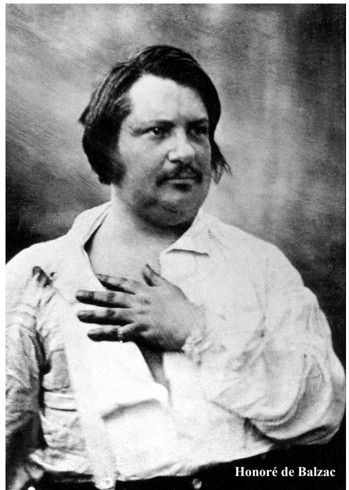
Honoré de Balzac

de Duitse Mark. Laatstgenoemde werden beschreven in het werk van de Duitse rechtshistoricus Georg Ludwig von Maurer. Wat Marx en Engels aantrok in de beschrijvingen van dergelijke oude, pre-kapitalistische gemeenschappen door Maurer en andere historici was dat daarin een vorm van samenleven naar voren kwam die bepaalde kwaliteiten had die ten gevolge van de kapitalistische productiewijze verloren waren gegaan maar die model konden staan voor de wijze waarop een toekomstige communistische maatschappij ingericht zou kunnen worden. Marx' bekende ideaal van de 'vrije associatie van producenten' gaat hier bijvoorbeeld deels op terug.