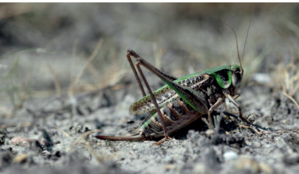
De Wrattenbijter is afhankelijk van een gevarieerde vegetatiestructuur, met open bodem voor het afzetten van eitjes en de ontwikkeling van nimfen en hogere vegetatie als zangpost en om in te schuilen. Door verzuuring als gevolg van hoge stikstofdepositie verdwijnt deze afwisselende vegetatiestructuur.

De directe en indirecte effecten van een hoge stikstofdepositie hebben grote gevolgen voor de faunadiversiteit in Nederland en Vlaanderen. In de PAS is deze problematiek geanalyseerd en uitgewerkt in het kader van Natura2000 doelstellingen, zowel voor diersoorten in beschermde habitattypen als voor diersoorten van de Vogel- en Habitatrichtlijn in leefgebieden buiten deze habitattypen. Beheerders worden in de PAS handvatten geboden om zowel voor vegetatie als voor diersoorten maatregelen te nemen die de effecten van hoge stikstofdepositie zoveel mogelijk mitigeren. Dit artikel geeft een sterk vereenvoudigd beeld van de doorwerking van stikstofdepo-