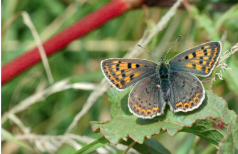
De rupsen van de Bruine vuurvinder kennen een lagere groei en hogere sterfte wanneer ze eten van Veldzuring die groeit onder hoge stikstofbeschikbaarheid.

Er komen steeds meer bewijzen dat ook de chemische samenstelling van planten zodanig verandert door stikstofdepositie, dat dit gevolgen heeft voor de voedselkwaliteit van planten voor herbivoren. Deze veranderingen treden waarschijnlijk eerder op dan verschuivingen in soortensamenstelling van de vegetatie en zijn bovendien niet of nauwelijks zichtbaar. Onderzoek naar de effecten is nog schaars en over de manier waarop de voedselkwaliteit precies verandert bestaan nog veel kennislacunes. De belangrijkste verandering als gevolg van stikstofdepositie is een toename van het stikstofpercentage in de plant. Hoewel stikstof in planten limiterend is voor herbivoren, betekent een hogere stikstofpercentage in planten niet per definitie dat de voedingswaarde toeneemt. Uit onderzoek op stuifzanden, heiden en bossen van arme zandgronden blijkt dat de extra hoeveelheid stikstof in o.a. Buntgras ( Corynephorus