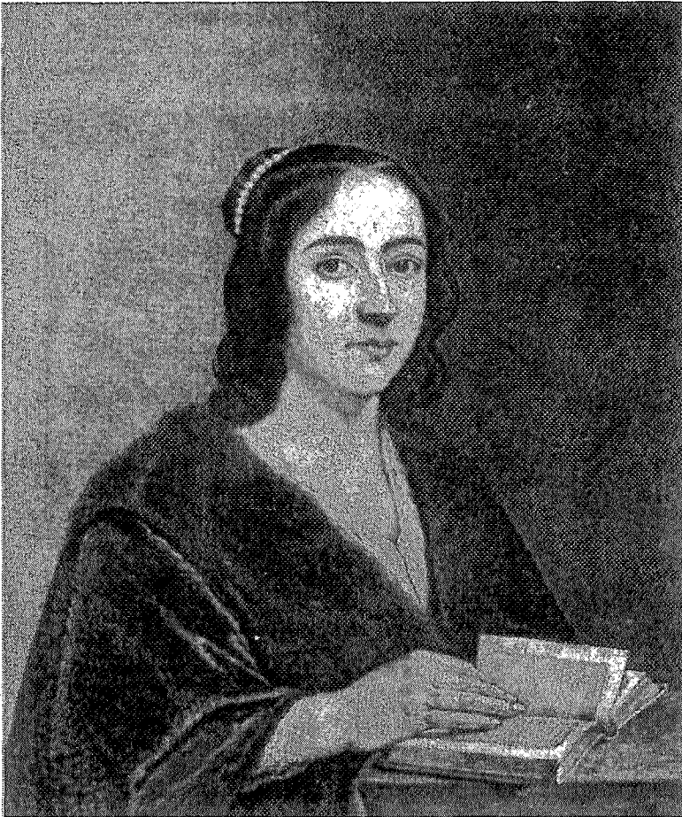
Portret uit 1649 door Jan Lievens van Anna Maria van Schurman.