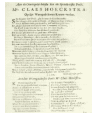
Een van de Spottedichten uit de 'Tweede druk' (ill. Tresoor, Leeuwarden). Hogere resolutie .

[...] nijemant zal zijn Rym verlengen of' verkorten, Maar laten 't staan, als 't gaat met horten en met storten,