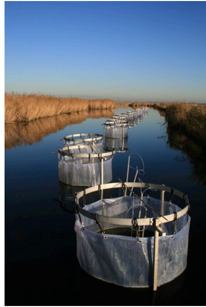
Figuur 1: Onderzoekopstellingen

Links het aquariumexperiment in het laboratorium en rechts de enclosures in het IJperveld.