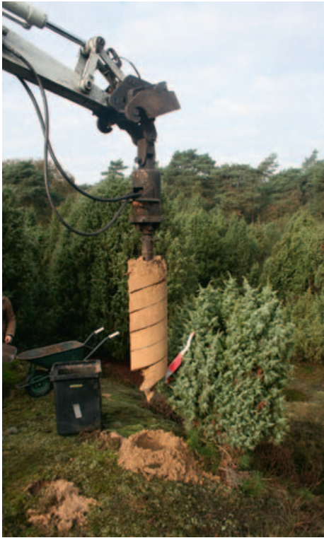
FIGUUR 6 In de Boshuizerbergen wordt kleinschalig de tweede experimentele benadering onderzocht: revitalisering van oude struwelen van de Jeneverbes ( Juniperus communis ) via het verrijken van de diepere bodemlaag (0-100 cm) met dolocal en patentkali.

een diepte van één meter geboord binnen een straal van 1,5 meter van de stam [figuur 6]. Door de opgeboorde bodem werd 500 gram dolocal en 50 gram patentkali ( K_2O ) gemengd waarna de bodem werd teruggestort in het boorgat. Ook zijn in de boorgaten wortels van Jeneverbessen verzameld om de nutriëntenstatus, vitaliteit en mycorrhizabezetting te kunnen bepalen.