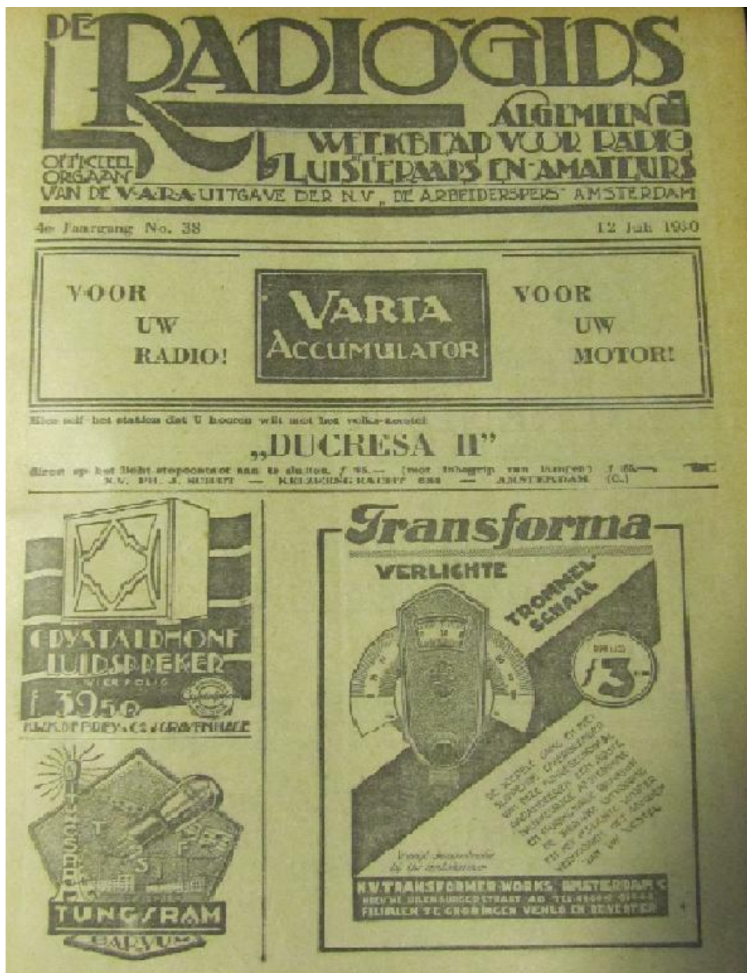
Afb. 1: Omslag van De radiogids , 12 juli 1930.

middelende doelen die Kuyper en de zijnen zich stelden, maar ook in het kader van de contemporaine receptie van de radioliteratuurbeschuwing. In het centrum van het papieren circuit – de dagbladers en de (literaire) tijdschriften – werden de boekenhalfuurtjes van A.M. de Jong bijvoorbeeld nauwelijks gereciperd. 11 Onbekend is echter of de radioliteratuurbeschuwing wel een rol van betekenis speelde in papieren media die zich dichter bij de bron bevonden: de afzonderlijke omroepgidsen.