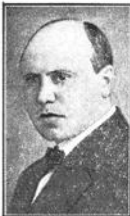
Willem de Mérode.