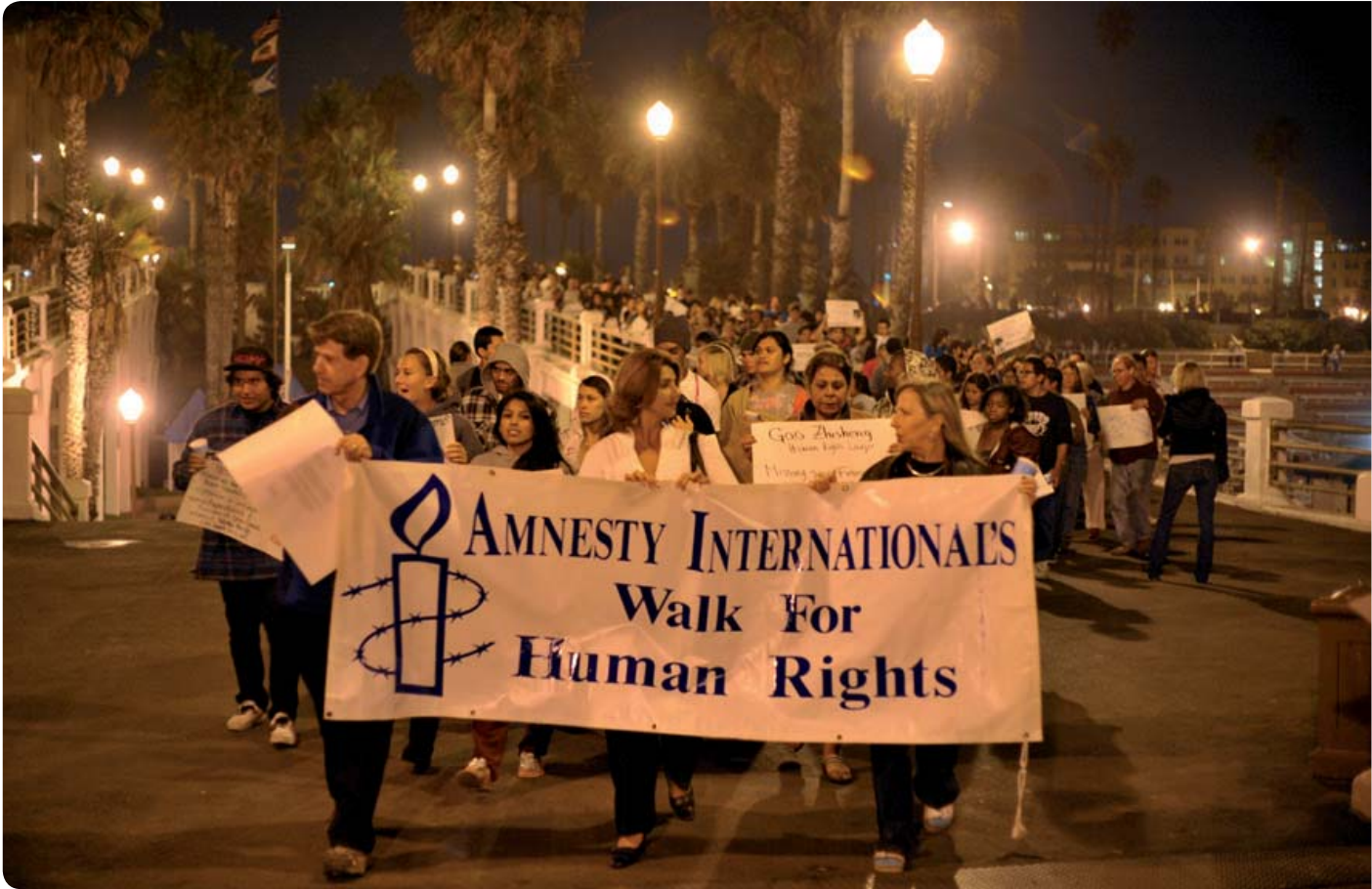
Bijeenkomst van Amnesty International in Ulm, Duitsland.