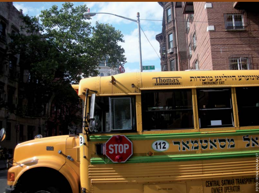
Schoolbus van de orthodoxe joodse gemeenschap brengt kinderen naar speciaal onderwijs.