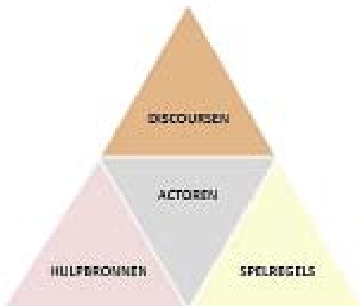
FIGUUR 2: DE DIMENSIES VAN EEN BELEIDSARRANGEMENT, ALLEN MET ELKAAR VERWEVEN.

Onderstaande figuur geeft weer dat de vier dimensies sterk met elkaar verweven zijn. Veranderingen in een dimensie leiden tot aanpassingen in de anderen dimensies. Zo zal een veranderend discours ook leiden tot veranderingen in de andere dimensies.