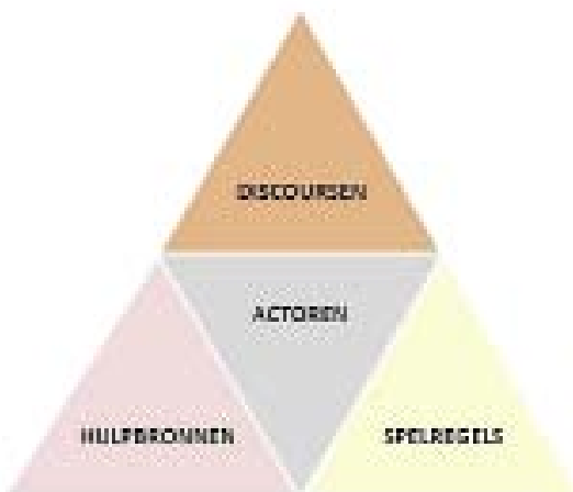
FIGUUR 2: DE DIMENSIES VAN EEN BELEIDSARRANGEMENT, ALLEN MET ELKAAR VERWEVEN.

Onderstaande figuur geeft weer dat de vier dimensies sterk met elkaar verweven zijn. Veranderingen in een dimensie leiden tot aanpassingen in de anderen dimensies. Zo zal een veranderend discours ook leiden tot veranderingen in de andere dimensies.