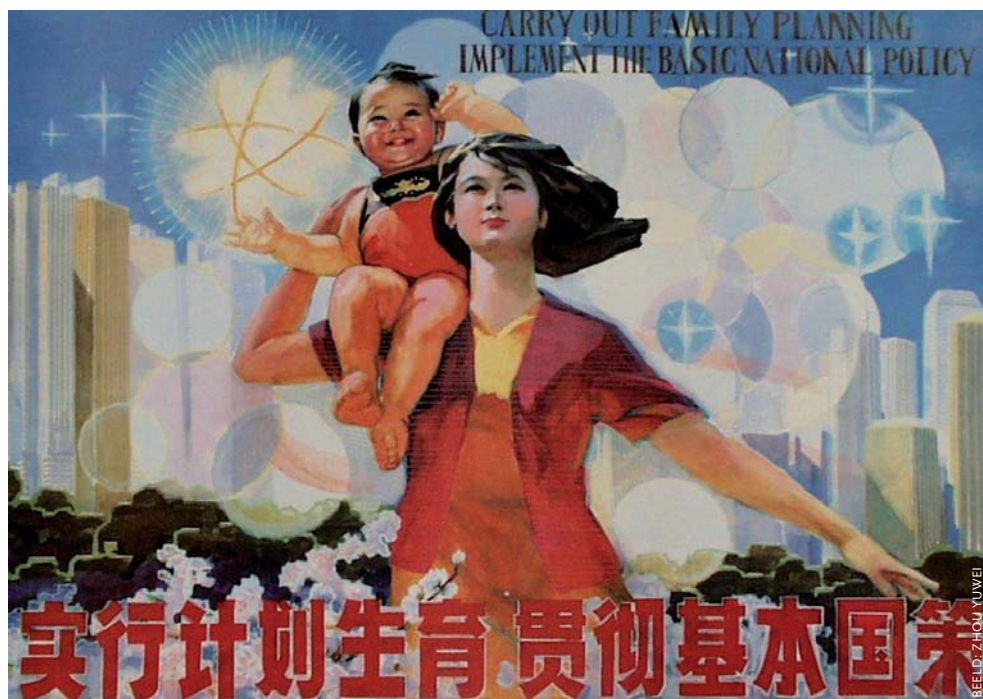
Deze poster uit 1986 illustreert de latere aanscherping van de Chinese bevolkingspolitiek waarbij ouders nog maar één kind mogen hebben.

Daarna volgden de maatregelen die in de westerse pers met veel afschuw worden beschreven: vrouwen die al een kind hadden, kregen verplicht een spiraaltje en bij de geboorte van een tweede kind volgde gedwongen sterilisatie. Tussen september 1981 en december 1982 werden 16,4 miljoen vrouwen en 4 miljoen mannen gesteriliseerd. Minder aandacht krijgt het feit dat de strikte eenkindpolitiek betrekking had op een relatief klein deel van de Chinese bevolking. Alleen in Beijing en andere grote steden werden de regels onverkort toegepast. In totaal gaat het om 17% van de bevolking. Voor 70%, vooral in de landelijke gebieden van achttien provincies, waren twee kinderen toegestaan wanneer het eerste een meisje was. In vijf andere provincies (10%) was het hebben van twee kinderen toege-