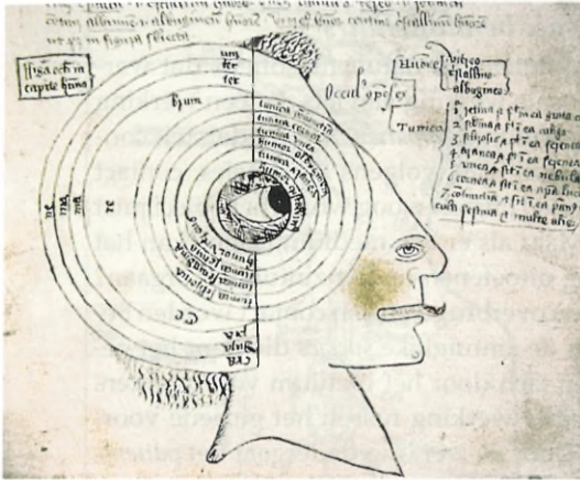
3. Afbeelding uit het boek van Macharias over het oog, veertiende/vijftiende eeuw. Londen, British Library, Sloane 981, f. 68r.

veroorzaken; maar als het patiens iets anders is, bijvoorbeeld ijs, dan zal dit leiden tot smelten.