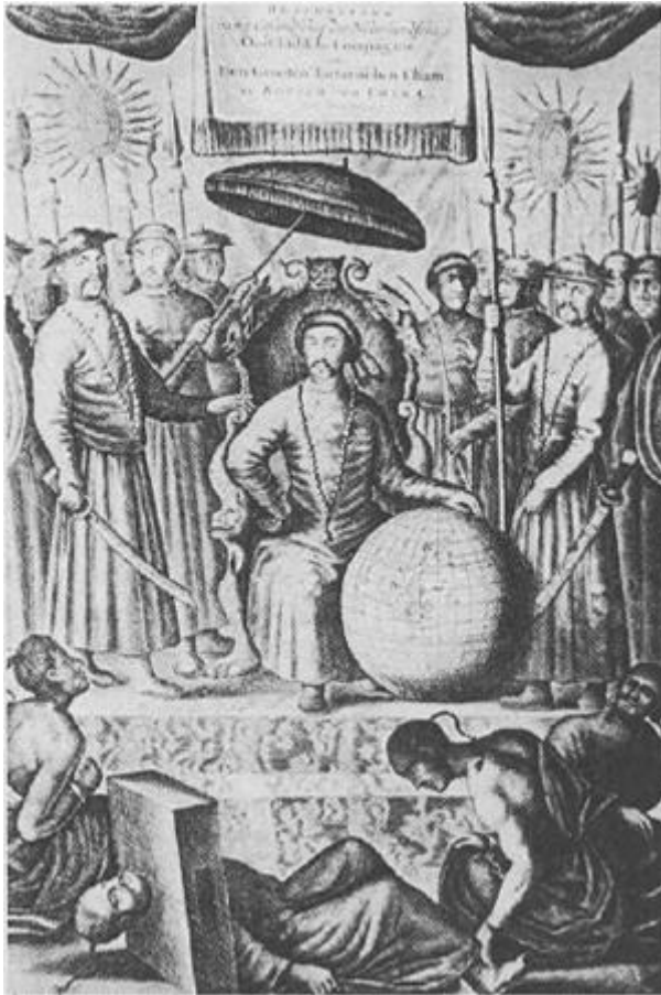
Titelgravure van Nieuwof's 'Chinaboek'.