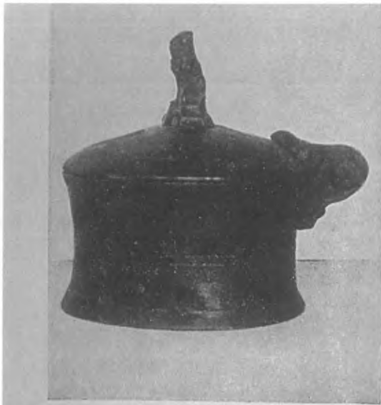
Afb. 6. - Tinnen zoutvat. 15e-16e eeuw.

eeuw, met de gekroonde hamer en een meesterteken gemerkt. Tenslotte mogen wij nog wijzen op een afbeelding van een rechthoekige tinnen plaque op het schilderij „Familiegroep” van Jan van Scorel, waarop zelfs de keuren, o.a. een gekroonde hamer, duidelijk te herkennen zijn.