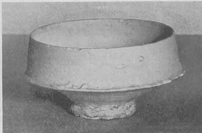
Afb. 3. Siegburg drinknapje Coll. H. J. E. v. Beuningen

men, moge een korte beschrijving hiervan volgen.