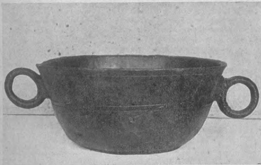
Afb. 1. - Tinnen papkom, 15-16e eeuw.