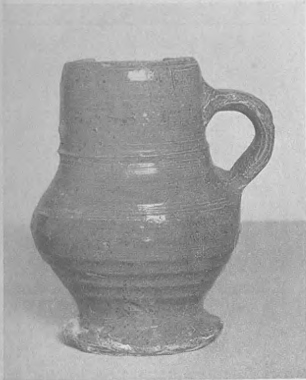
Afb. 2. - Duitse kruik met geknepen voet. Coll. H. J. E. v. Beuningen

een tinnen papkom aangeboden, die wij eerst niet direct konden thuisbrengen, daar er geen keuren of merken op voorkwamen. Ook de plaatsing van de oren (zie afbeelding) was ongebruikelijk. Door een toeval kwam ons enkele dagen nadien de afbeelding van het schilderij van Mostaert onder ogen, waardoor datering mogelijk werd. En deze papkom, enige jaren geleden te Rotterdam opgegraven, werd nu direct aangekocht en behoort tot onze meest dierbare verzamelingsstukken. Ook de andere afgebeelde gebruiksvoorwerpen zijn echter belangwekkend en doordat in de verzameling van schrijver dezes toevallig bijna al deze voorwerpen voorko-