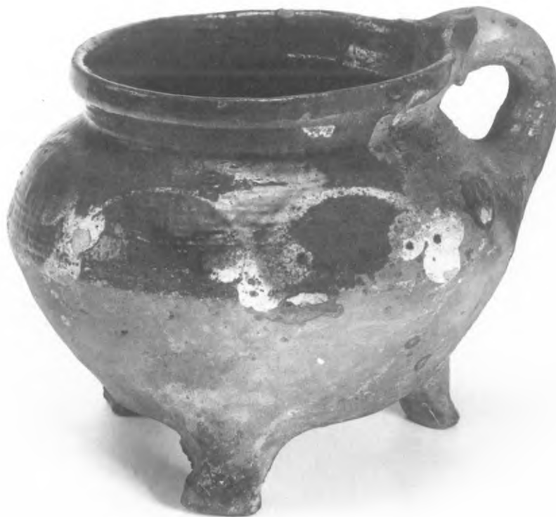
1. Kookkannetje, aardewerk met slibversiering (15de eeuw); bodemvondst Rotterdam, door H.J.E. van Beuningen verworven in 1952. Collectie Van Beuningen-de Vriese, Museum Boijmans Van Beuningen (F 3).

In de hier volgende bibliografie van H.J.E. van Beuningen worden zijn bijdragen opgenomen die inhoudelijk ingaan op historische objecten. De talloze inleidende woorden die hij schreef als 'Woord vooraf', 'Voorwoord' of 'Ten geleide' zijn