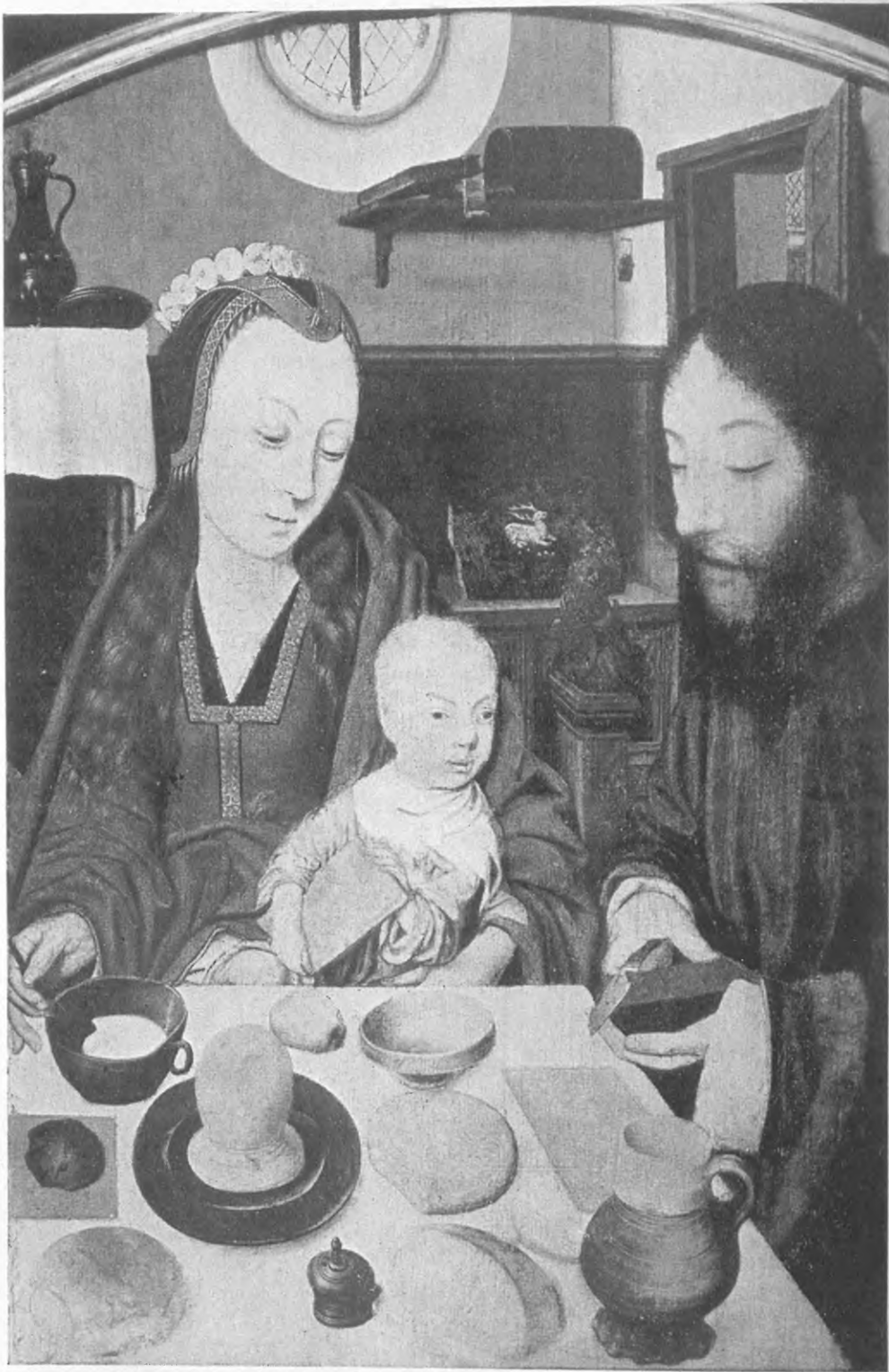
De Heilige Familie. Toegeschreven aan Jan Mostaert.