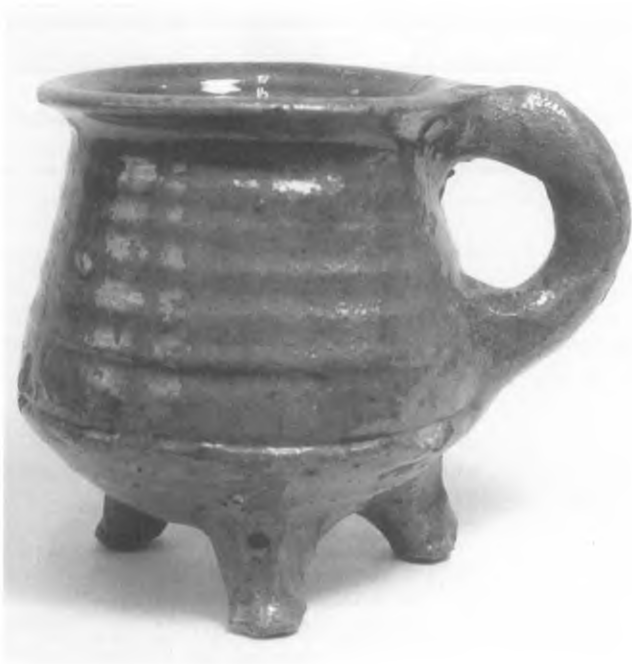
2. Kookkannetje, aardewerk (15de eeuw); bodemvondst Rotterdam, door H.J.E. van Beuningen verworven in 1953. Collectie Van Beuningen-de Vriese, Museum Boijmans Van Beuningen (F 8).

Uit het overzicht van publicaties vallen verschillende dingen te lezen. Allereerst blijkt natuurlijk duidelijk hoe Van Beuningen sinds 1947 continu als verzamelaar en connaisseur in de weer is gebleven. Zijn eerste artikelen heeft hij ongetwijfeld met pen op papier geschreven, vervolgens deden schrijfmachine maar ook secretariële ondersteuning hun intrede. Zijn jongste artikelen componeerde hij eigenhandig achter de tekstverwerker en al snel op de pc. Tenslotte is Van Beuningen in dit magische jaar 2000, waarin hij ook zijn tachtigste verjaardag viert, met volle overgave aan het werk om met behulp van de laatste technologische