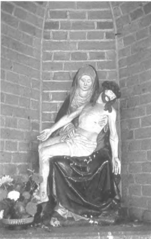
Het cultusobject is een pietà, Maria met haar dode zoon, uit de eerste helft van de 14e eeuw.