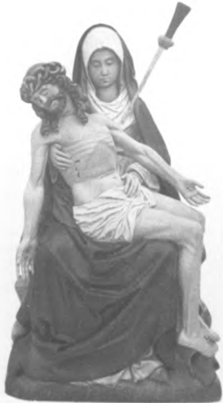
O. L. VROUW TER NOOD GODS BERGHAREN (GLD.)

Bedevoertprentje, eerste helft 20e eeuw. Collectie KDC, Nijmegen.