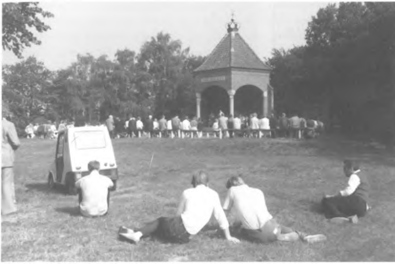
Bedevoertmis op 15 augustus 1984, Foto P.J. Margry.