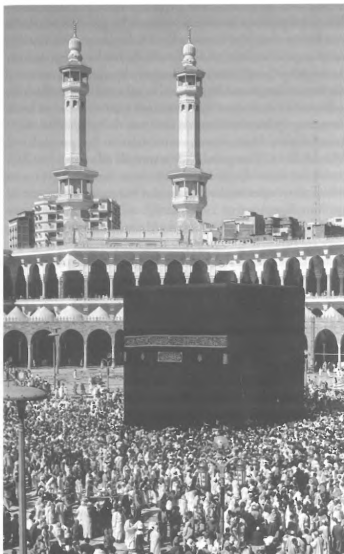
Hedendaagse pelgrims in gebed voor de Kaaba in Mekka.