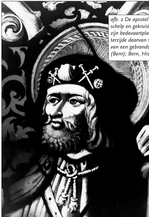
afb. 2 De apostel Jacobus de Meerdere als pelgrim. Op zijn hoed de schelp en gekruiste miniatuur-reisstaffes als pelgrimstekens die naar zijn bedevaartplaats Santiago verwijzen; terzijde daarvan speldjes met een kruis en gebedsknopjes. Detail van een gebrandschilderd glasraam uit de kerk van Jegenstorf (Bern); Bern, Historisches Museum

6 Estius, Historia Martyrum Gorcomiensium . Douai 1603; reprinted in: Acta Sanctorum Julii II , Venice 1747, c. 7 (col. 799): '... figuras crucis Hierosolymitanae, quae illi, ut Terrae Sanctae peregrino, erant in pectore et dextro brachio ita certa ratione inscriptae, ut carne integra deleri non possent, adhuc viventi e carne homines inimici, crucis Christi crudeliter exciderunt'.